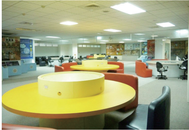
圖五：縣府綜合大樓一樓閒置空間即將活化為「暨大跨領域橋接學苑」

考。然而，該如何促使這些子計畫持續深化，讓研究團隊從研究諮詢者的角色成為促進者及參與者，亦是大地計畫所面臨的重要挑戰。對此，過去一年來，暨大與南投縣政府協力透過橋接學苑的設立以及縣府委外合作，嘗試克服這兩項困境與挑戰。