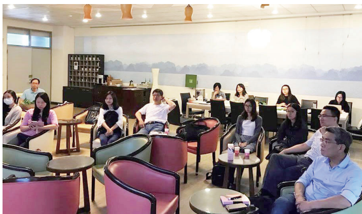
圖三：每月舉辦研究聚會分享子計畫成果