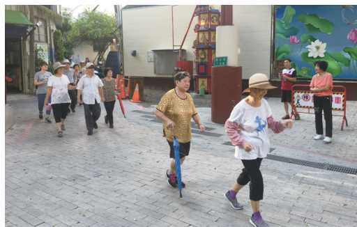
圖三：社區內健走路線