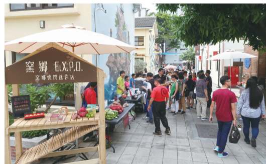
圖六：2018年6月在臺南的藍晒圖文創園區展示東山窯鄉的農業文化意涵與產品