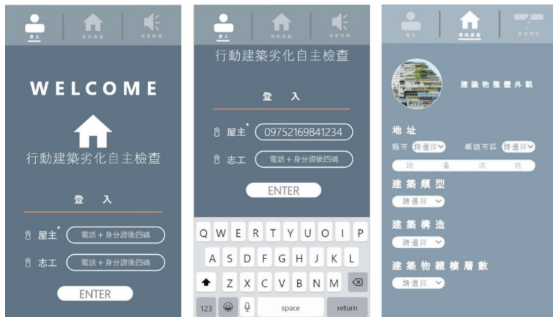
圖十：建物劣化自主檢查 APP (發展中)

第三年計畫嘗試結合專業理論與科技技術，發展韌性社區減災與準備的技術工具。包括將(1) 建物劣化自主檢查機制結合手機操作的 APP，以利在災害當下可以爭取建物損壞情形的紀錄時效與減輕專業人員的負荷；(2) 發展企業防災實務，藉由在地企業的災害經驗，輔以相關專業理論，協助企業發展因地制宜的企業防災持續營運計畫；(3) 將心理韌性結合防災教育的經驗具體化，發展結合教學內容、影音、桌遊材料等在地防災教育模組。