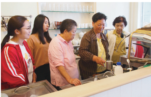
圖二：熟齡吧檯手行動