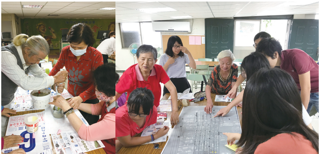
圖九：結合社區日常生活的大學與社區共學共作防災教育

第二年，各分區大致上完成相關急迫性的重建工作，因此，計畫團隊轉而發展各場域的「減災」與「準備」行動，思考將實作行動結合在社區日常生活的可能性。包括：(1) 在安南區溪頂里的實作行動，思考如何將「防災教育」結合於「關懷據點」的活動內容中；也期待帶動社區志工團隊的組立；(2) 玉井儲蓄