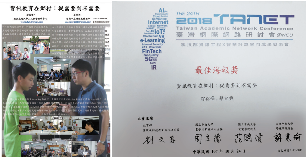
圖八：於 TANET 2018-臺灣網際網路研討會發表，獲得最佳海報論文

在現場帶，有看到分組教學過程中，程度好的與程度差的，需要給不同的作業方向，這是我們過去一個人教資訊課無法看到與解決的問題，所以你們讓我學到要注意課程安排與設計，所以我們想試試看，不是因為你們教不好，而是因為你們教得太好了，我們才想自己教教看」。這個方案經過整理，在 TANET 2018-臺灣網際網路研討會發表。