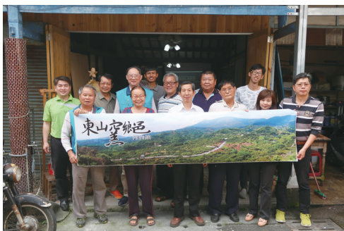
圖五：與大東原各個社區發展協會領袖討論推動「東山窯鄉」在地品牌

「里山共同體經濟」的具體願景，是串聯大東原在地社區的集體力量，共同實踐與創新符合大東原在地生態與文化情境的里山生活模式。