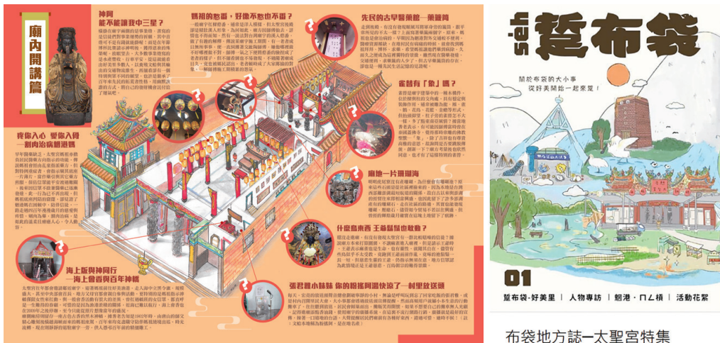
圖四：(左圖)太聖宮文史導覽地圖；(右圖)地方誌

經此鼓勵，我們將「宮廟文史導覽地圖」擴增轉譯，發展為地方誌第一期——太聖宮專刊，放置於當地供社區及觀光之民眾閱覽，引發了社區在公眾事務的積極討論，幫助我們進一步踏出社區擾動步伐。