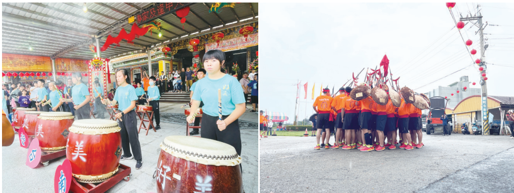
圖七：好美國小太鼓隊及臺南土城虎尾寮宋江陣

然而，疫情影響使此傳統活動中斷多年。為重新啟動尋根之旅，嘉大與社區努力合作，包括在好美國小開設「虎尾寮的溯與拓」課程，使學生得以深入了解歷史脈絡意義。最後，經多方努力下，終在 113 年 4 月 28 日舉辦了歡迎土城虎尾寮鄉親回鄉的儀式。儀式中，好美國小太鼓迎賓、宋江陣精彩上陣，再結合嘉大國樂團的動人樂曲演出，促進社區居民對家鄉更深的連結，也延續了百年情誼。