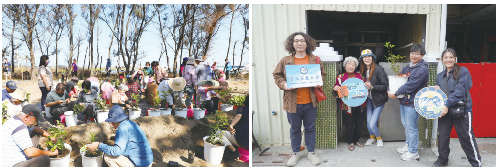
圖三：（左圖）嘉好花園社區共作活動；（右圖）送福貴到家活動

此外，每年博士後均結合學校嘉義巡禮通識課程、及開設通識課程，將學生帶入社區，進行社區生態與文化導覽，結合生態環境共善行動，透過行動培養學生對地方的認同與責任感。