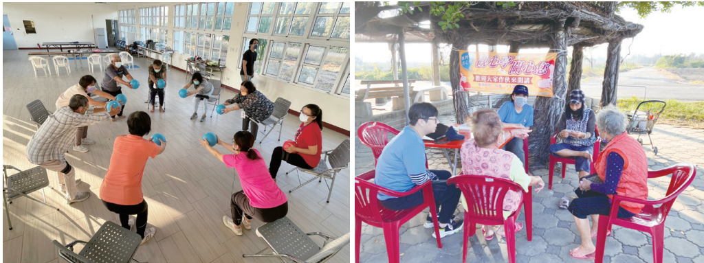
圖二：(左圖)好美運動班；(右圖)觀心亭療心站

最後，透過參與關鍵時刻的宗教組織儀式祭典與活動，塑造與地方的連結。包含農曆三月的媽祖生祭典、云庄、普渡等，地方教會每年定期舉辦的生態圍籬定砂、淨灘、植樹等，讓地方宗教組織頭人及居民，感受嘉大團隊對地方事務參與的投入。