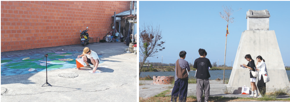
圖五：AR/VR定向活動環景拍攝及廟宇文化定向活動體驗

嘉大團隊結合數位科技教師專業，以 VR、AR 等數位科技技術規劃虛擬實境定向越野與環境教育永續發展行動方案，將在地的宗教、人文地景與觀光產業等資訊，設計符合更多元族群之內容，以更有趣、更具沉浸感的方式，完整地傳遞給來訪者。