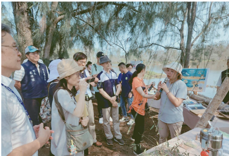
圖六：以社區夥伴角色協助國家環境教育獎參賽