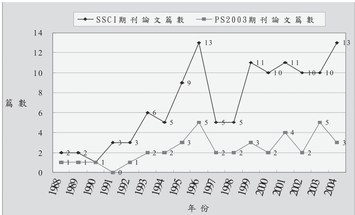
圖一：台灣政治學者在國際期刊發表之論文篇數

註1： Issues & Studies 第38卷第4期(2002年12月)與第39卷第1期(2003年3月)因合刊發行，因此有1篇於該期中的文章計入2002年。