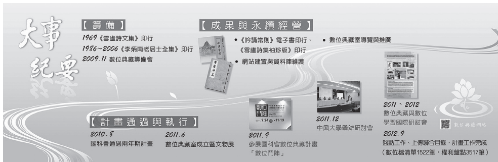
圖一 李炳南教化作品與生活紀錄典藏計畫大事紀要圖