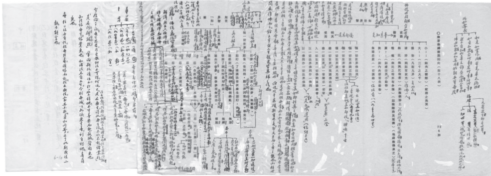
圖六 《華嚴經》講表手稿

數位典藏的工作內容，除了原本提出的預編藏品外，團隊成員更積極尋找搜羅先生相關典籍文物，發現許多未曾刊印或流通的手稿與影音資料，如