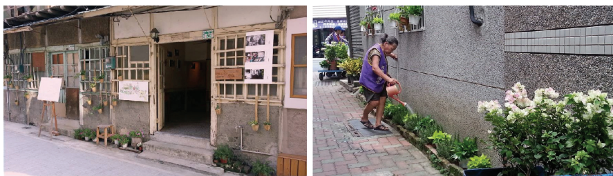
圖六 阿媽自己動手的环境藝術創作

「巷子裡的阿媽平常會來整理這個花圃；最近，也會將她自己種的西瓜藤移植到花圃中試種」、「這排老房子外面的植栽，是阿媽自己花錢買麵杓來布置的」。參與環境改造的居民，開始從他們的參與經驗，以主人意識，藉著空間的布置、整理、維護等來表達他們對於這個社區的感情。這學期因著通識課進入銀同社區觀察的學生也發現：「這個社區的老人家好像比較不怕生。當我們在巷子裡逛、欣賞這些有趣的藝術創作與植栽時，老人家就會一步一步、有意無意地靠近，然後，很得意地跟我們介紹那是他做的、怎麼怎麼做的，一副很厲害的樣子」。