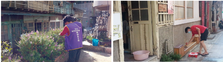
圖四 銀同社區日常生活的空間環境

舊市中心商業區面臨因早期發展而當代生活機能空間設施不足的課題。一般而言，在都市現代化的過程中，都市空間需要因應市民的生活需求與環境品質而有所變遷，例如：闢設公共空間、交通設施等重要都市機能設施與空間環境。近年來，隨著生活型態、社會環境及產業結構改變，傳統地域社會面臨瓦解；然而在此同時，舊市中心區往往又是都市空間與社會文化經過長年歷史變遷而產生的結果 (Conzen, 2004)，空間就是社會，保存實質空間，其實是要保存地方社會 (夏鑄九, 2003; Groth and Bressi, 1997: p. 9)，認為文化地景是交織在持續變動的日常生活與社會關係的動態過程，是人類共同營造、共同勞動的場所，文化地景建構了我們的意識型態。因此，舊市中心區的發展課題，就不只是公共空間與公園綠地的空間機能需求，同時也需要面臨當代社會的動態變遷；面對社區需求，工作站團隊思索的是空間環境與社區日常生活的動態關係。