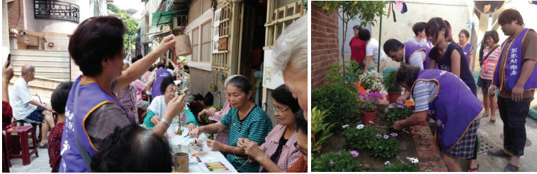
圖五 從回收創意的公共參與，進入到社區環境營造的場域

畫中安排「回收創意植栽製作」與「志工花草成長營」，讓居民從過去物件式回收創意創作的公共生活參與過程，逐漸地培養自己與社區的連結關係，接著才由社區居民與工作站團隊一起進到空間改造的場域。