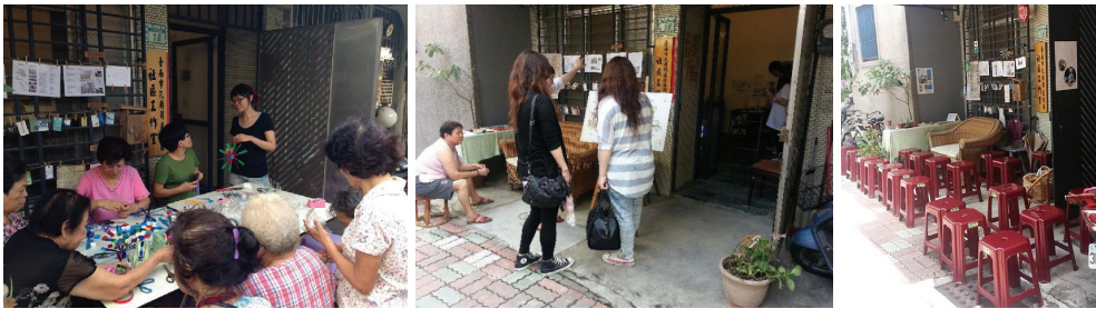
圖七 社區空間的多樣使用形式

銀同社區藉著私有閒置空地空屋的認養與再利用，將私有權屬的空間釋出作為支持在地老化的空間需求，這對於公共空間設施資源不足、土地難以取得的舊市區發展，提供了有別於建立新空間設施（例如：社區公園、照顧中心）的支持方式，也提高老人在社區空間使用的可及性。另一方面，在銀同社區閒置空間再利用過程中，同時也交互作用的產生因應社區在地老化的生活活動機能，例如：銀同祖孫園的綠色藝術創作展示與遊憩、社區活動功能、社區菜園的植栽、貓咪高地的綠色藝術創作展示、社區拋繡球活動、聚餐等，並藉著持續性的實作過程，逐漸累積老人社區活動的多樣性與社區空間的多樣使用形式。