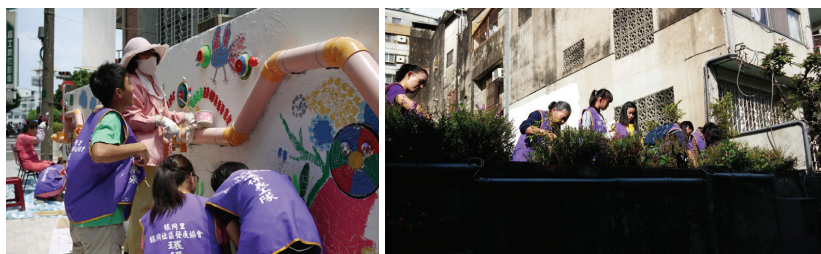
圖三 銀同社區中老與少結合的志工關係

銀同社區是高齡社區 7 。銀同社區尚未正式成立時，為了募集照顧社區老人與弱勢兒童所需要的資源，資源回收成為一開始社區資金來源的主要社區工作之一。2008年社區開始申請計畫資源補助，藉著資源回收工作的基礎，開展文化發展面向、社會照顧面向等結合回收創意的相關社區工作，例如：衣改會cosplay、看板變裝、KUSO樂團與活動表演服製作、二手貨交流等創意再利用；社區生活周遭、平凡且不起眼的物品，逐漸成為居民與居民連結與凝聚社區向心力的小種子。這些年來，所招募的社區志工中，最年長志工86歲，最年輕志工8歲，這樣老與少結合的志工關係，成為社區發展的主力。