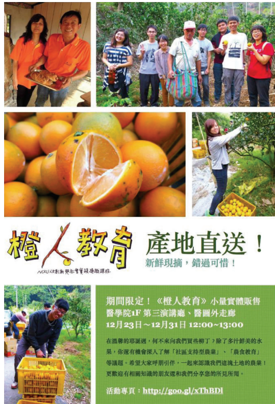
圖二 成大「大學社區協力農業」活動 DM

(permaculture) 的在地實作(可食花園)，與農友一同探討適合在地環境條件的永續耕作模式。另一個軸線的工作，是專注在東山傳統龍眼乾生產的文化與生態意涵的調查與論述深化，作為推動其成為臺灣重要農業文化遺產的基礎，並且搭配產地認證模式，試圖給予制度上的肯認，也作為一般消費者認識東山龍眼乾產品特色與文化意涵的重要連結途徑。