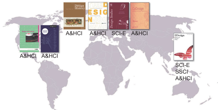
圖二 2016年國際間7本代表性設計研究期刊及其出版單位的區域分布情形

隨著開放式思維越來越獲得重視，近年來開始有許多期刊提供部分的文章，免費提供給大眾公開瀏覽；甚至也有數本新期刊，也全面採用 IJD 的開放模式來營運，包括：英國 Cambridge University 出版社發行的 Design Science （由 Design Society 支持並於 2015 年創辦）；中國同濟大學出版的 She Ji: The Journal of Design, Economics, and Innovation （由 Elsevier 負責編輯