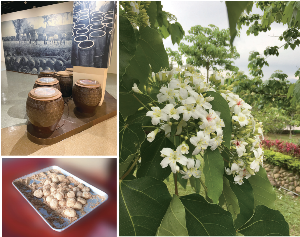
圖四：客家象徵符碼：客家醃缸(左上)、菜粿(左下)、油桐花(右)

再據徐兆泉編著《臺灣四縣腔／海陸腔客家話辭典》「硬頸」亦指稱頑固、冥頑不靈，如「硬頸牯／硬頸嫲」例句「該隻硬頸嫲，刀仔架頸根都怕毋會讓步，毋使去求佢」(那個頑固的女人，刀子架在脖子上都恐怕不會讓步，不用去求她)，也是具有貶低的負面意涵。令人好奇的是「硬頸」一詞由具有負面義的客語特殊詞彙，逐漸轉為可代表客家意象之正面象徵符碼，是什麼樣的機制促使了這種轉變？