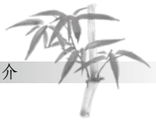
表一：導讀教授、研究生相關著作簡介（接上頁）