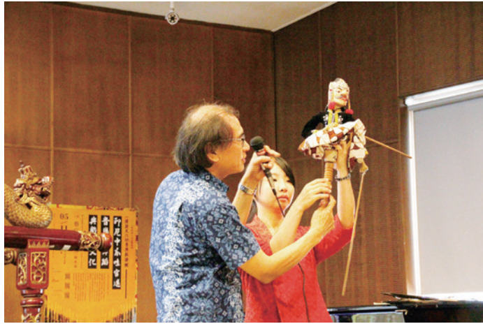
圖九：立體木雕的葛雷克木偶戲