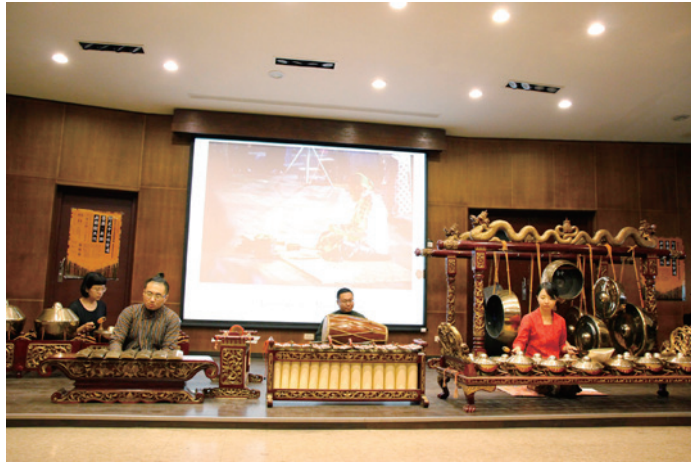
圖六：甘美朗樂器演奏