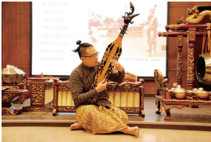
圖四：印尼區域性音樂（達亞克族）Sapeh 樂器

除甘美朗音樂外，中爪哇宮廷中有一種名為貝多優 (tari bedhaya) 的傳統舞蹈，是由女性舞者演出、且最具有宗教神聖性質的宮廷舞蹈。貝多優舞蹈傳說