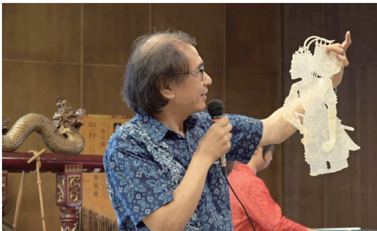
圖八：以牛皮製作而成的皮影戲偶樊梨花的原始樣貌（未上色）

傳統藝術可說是國家或民族建立認同的重要媒介，中爪哇宮廷身為重要的文化藝術整合單位，除了傳承有形與無形的文化資產，也與印尼政府文化部門及中爪哇兩所藝術大學建立密切關係，整合了政府、教育單位與藝術家的資源，使得爪哇傳統文化得以獲得良好發展。蔡教授指出，印尼將藝術文化視為生活的一部分，而不是作為被高舉並需要格外保護的對象，因此印尼雖具有最多元的藝術文化，卻多不見登載國際無形文化資產。但就學術研究方面，印尼