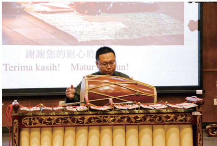
圖七：甘美朗Kendang樂器演奏

由南海女神拉都琪都親自編舞，對中爪哇宮廷而言，其具有強大的神祕力量，足以保護宮廷內長治久安，因此每年在女神拉都琪都生日前一週，宮廷內便於高階官員的女兒中，挑選九名未婚、年輕貌美、動作優雅且熟悉甘美朗節奏的女性培訓，並於女神生日當天演出，以保持其聖性。貝多優舞蹈除於女神生日演出外，現今於蘇丹王登基、生日、宮廷婚禮、外國總統或大使蒞臨及傳統宮廷宗教儀式等場合也會演出。演出時舞者面對蘇丹王，並以數種不同的演出隊形變化呈現象徵意義，其中最典型的隊形即為開場隊形，九名舞者分別代表著左手、右手、頭部、頸部、胸部、生殖器、左腳、右腳等人體部位與內心慾望。蔡教授指出，貝多優舞蹈不僅反應其宗教意涵，亦兼具現實的政治作用，