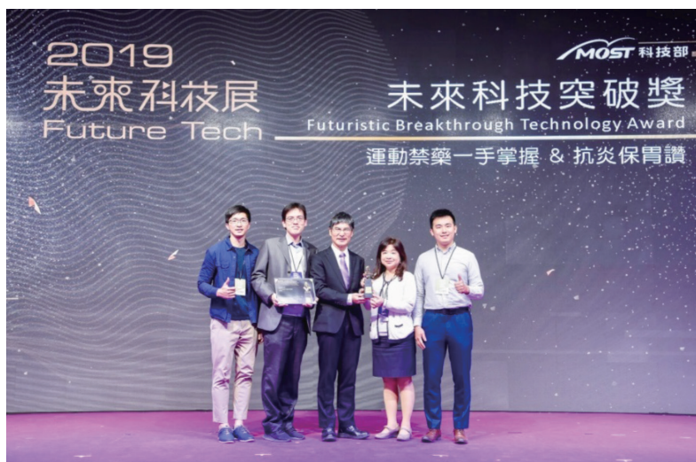
圖三：科技部陳良基部長頒授「未來科技突破獎」予本研究團隊