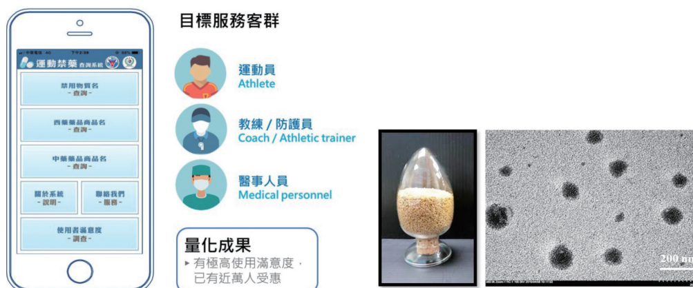
圖一：運動禁藥一手掌握——「運動禁藥行動應用程式」之介面與目標服務客群(左)及 抗炎保胃讚——「穿心蓮內酯奈米化製劑」產品及其分散於水溶液之外觀(右)