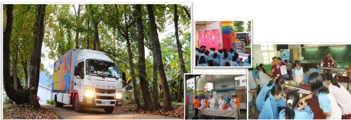
圖三，化學車與化學車活動照片