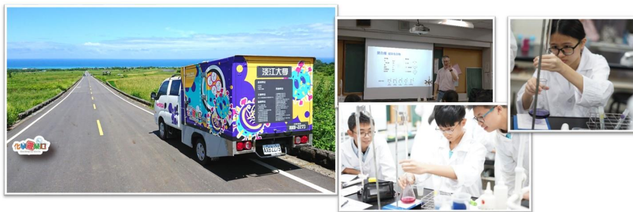
圖四，分析車與分析車活動照片

3. 結果與討論 - 除了做實驗，數據結果的討論與呈現是分析實驗中最重要的一環，在活動中由講師引導，將傳統分析實驗方式與現代光譜儀器的結果進行比對，並讓參與同學的實驗結果能以科學的方式呈現，並相互推理討論實驗過程中的誤差原因、歸納出改良的方式，能夠對實驗的內容與科學性的思考方式有更深的體驗。