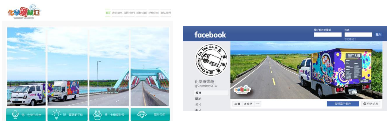
圖六，左:化學遊樂趣網頁，右: 化學遊樂趣 Facebook 粉絲專頁