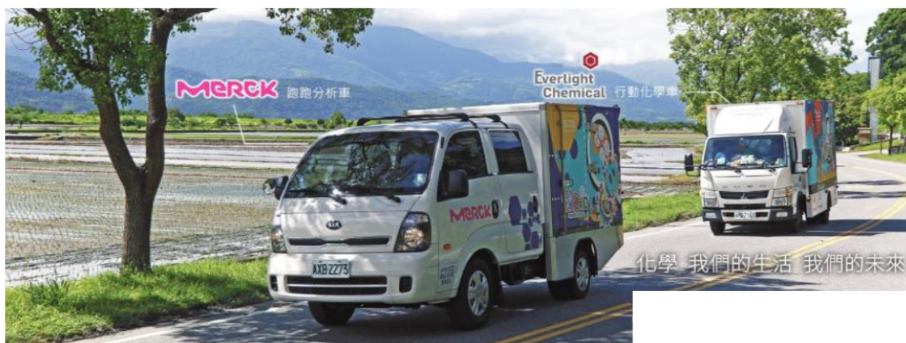
圖二，分析車與化學車

普活動展演與整合能力，並結合大專院校課程，為學生提供長期實務經驗，培養科普推廣人才。以國中以上之學生為目標，在未來除了繼續將巡迴的目標放在未曾拜訪過的地區之外，在重複探訪部分舉辦活動過的學校，將加強與校方的意見交流，並觀察活動對於偏遠地區學生學習風氣的影響。