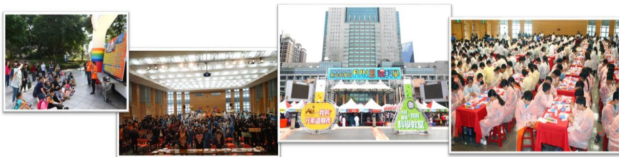
圖五，新北科學日、科教館等大型科普活動照片

我們曾採用百人操作的大型實驗室加上雲端同步統計實驗結果的大型活動，在活動前進行教師研習與工作坊，活動日在新北市各地各地同步進行實驗，各地將實驗結果回傳至主場進行統整，主場再將結果整理分析後回傳，可得到當時全新北市各區域的實驗比較結果。這些實驗教材教案與設備在活動後交由參與學校的教師，作為課程補充教材，一方面延長活動的時間效益，一方面更能協助教師教導新課綱所強調探究與實作的精神，提高國人科學素養。