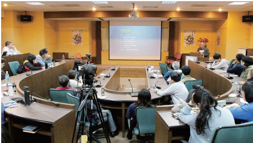
圖一：「晚明思潮與五四新文學運動」人文沙龍講座

於1919年第一次世界大戰後的巴黎和會上，世界列強將戰敗國德國於中國山東殖民地之權力轉讓給日本，引發當時北洋政府轄下的北京爆發了以學生、青年為主體的示威、請願運動，亦包含廣大市民與工商人士等中基層參與，認為北洋政府未能捍衛國家利益，遂以「外爭國權，內除國賊」為口號，主張對抗列強侵權與懲處媚日官員。就當時社會而言，此一運動對於外交關係、政治發展、社會經濟、教育方針、思想文化均有影響，且對中國共產黨的發展也具有重要作用，此即新文化運動的開端，如胡適(1891-1962)、陳獨秀(1879-1942)、周樹人(筆名魯迅，1881-1936)、蔡元培(1868-1940)、錢玄同(1887-1939)等受過西式教育的知識分子，以「反傳統、反儒家、反文言」等核心價