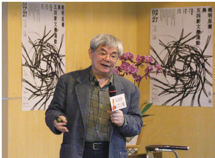
圖二：主講人楊儒賓教授

值，引發一連串思想文化與文學革命運動。其中陳獨秀在其主編刊物《新青年》上，撰文提倡追隨「德先生」（指民主，英文「Democracy」音譯）和「賽先生」（指科學，英文「Science」音譯），並傳播馬克斯主義思想；以胡適為代表的溫和派，則反對馬克斯主義，主張以實用主義代替儒家學說，因而支持白話文運動，認為文學作品不應只講求形式，應著重內容與情感的表達。這一波五四以來的新文化運動影響深遠，當時反傳統、求改革的風氣瀰漫，刺激知識分子對於文化、思想、教育、文學的重新思考。因五四新文學運動的影響，中國馬克斯主義學者聲稱，晚明時為資本主義萌芽期，反應於晚明的小品文、戲劇、小說之中，此三類文學作品雖於此前已有，但在晚明時尤為發達，這些新興文學代表市民、社會，具有反抗封建主義道德的意義，也具有特殊的思想史價值，可視為五四新文學運動的前驅。對此，清華大學哲學所講座教授楊儒賓提出質疑，認為這是一種被「畫歪臉」（魯迅語）的文學影響及五四新文學運動的內涵。本次人文沙龍講座即邀請楊教授以「晚明思潮與五四新文學運動」為題，針對上述觀點提出見解。