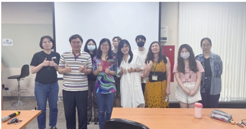
圖三：EduACT 工作坊結束後與會者合影留念

EduACT 平臺也引入了高度直覺性的「對話式代理人建構」(Creating agents via chatting with teachers) 功能。教師無需具備程式背景，僅需透過與系統進行自然語言對話，即可定義出代理人的行為模式與教學目標，這極大化了「賦能教師」的設計初衷，透過平臺機制促進了教師間的經驗分享與協作，為教育現場建立起一個可持續發展的 AI 教學資源生態系。本場在系列中扮演關鍵橋接角色，將「人機協作」的理念落實到教師可實際操作的教學設計層面。