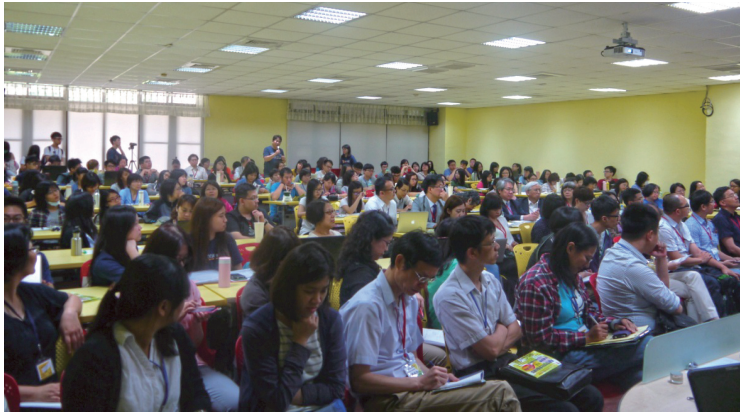
圖三 2016年社會福利學會年會專題演講參與者

公約、土地正義、環境保護和食品安全等納入討論議程，共邀 24 位不同領域的社會福利／倡議團體代表擔任與談人，暢談社會福利運動如何透過陳抗、遊說、現身等不同策略，介入各式社會福利政策，造成什麼樣的政策發展影響。