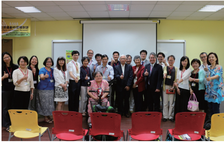
圖二 2016年社會福利學會年會與會貴賓——專題演講、論壇發表人

原則的制度意涵。接著，年會邀請四位立法院社會福利及衛生環境委員會立法委員，暢談進入國會後欲推動的立法藍圖，以及可能遭遇的困難，尤其其中三位曾為社會運動團體代表，若未來與民間團體意見相左時又該如何抉擇。最後，由於許多社會福利政策為地方自治範疇，因此地方政府作為福利輸送的第一線，其局處首長的施政願景為何、與中央政府、其他縣市及民間團體間如何合縱連橫，都攸關當地社會福利的發展，年會邀請四位直轄市社會局長親自到場現身說法。