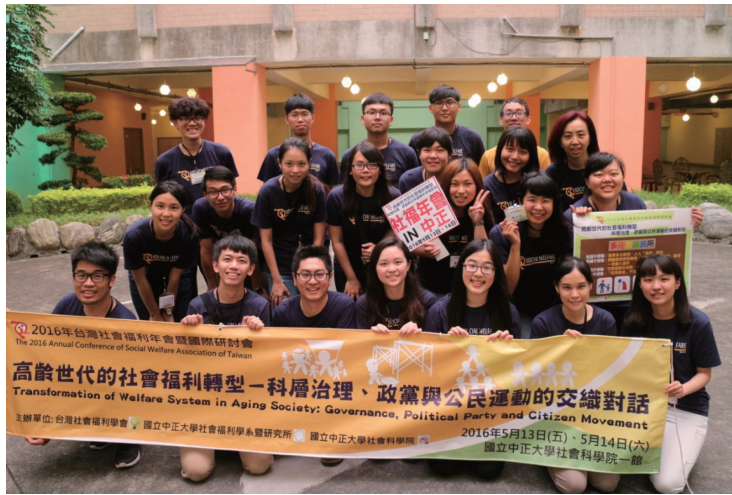
圖四 2016年社會福利學會年會所有工作人員