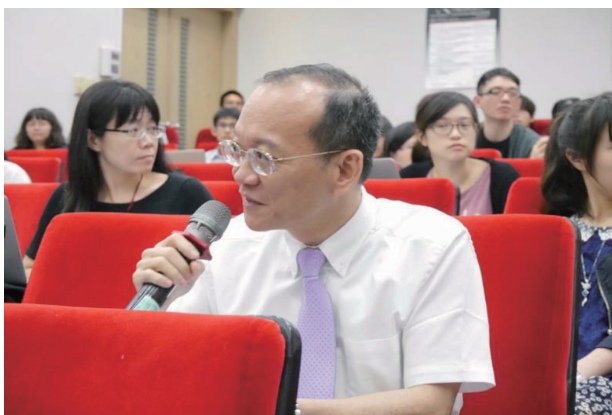
圖九 綜合座談：王泰升，國立臺灣大學法律學院講座教授