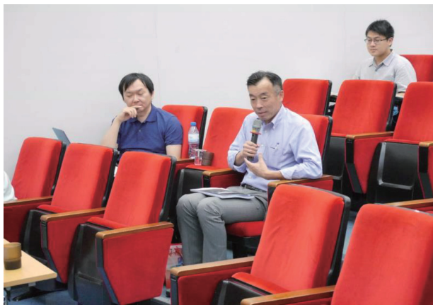
圖八 綜合座談：鈴木賢，日本明治大學法學院、北海道大學榮譽教授

過往針對原住民族文化、習慣與法律之相關研究，往往流於片面，或僅針對部分法面向而為研究與探討，以致於無法彙整出一既完整且完善實現原