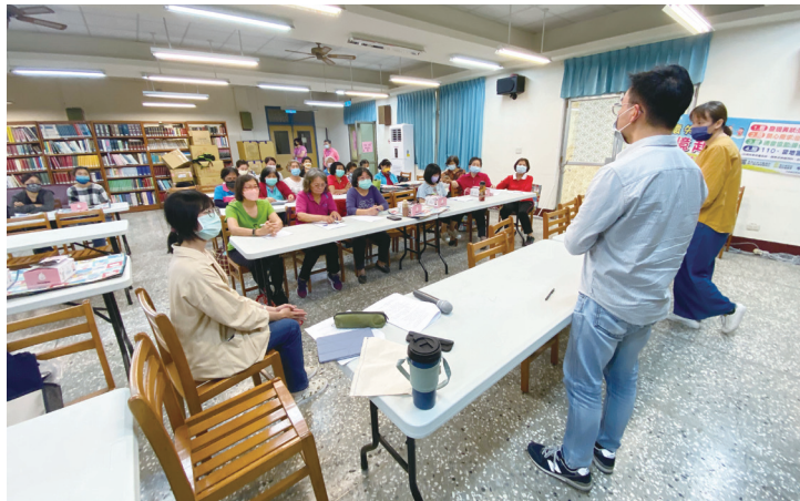
圖二：成大團隊辦理志工培訓 (資料來源：本研究)

志工作為成大團隊、五人小組與商家的中介角色，並在友善組織方面斬獲效益，是始料未及的。而志工的行動，為五人小組帶來動力，對後續五人小組的業務討論有實質幫助。具體而言，志工們相當支持成大團隊，對失智症「去汙名化」工作的推動，帶動五人小組後續之動能。