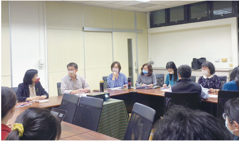
圖三：成大團隊拜會屏東縣政府