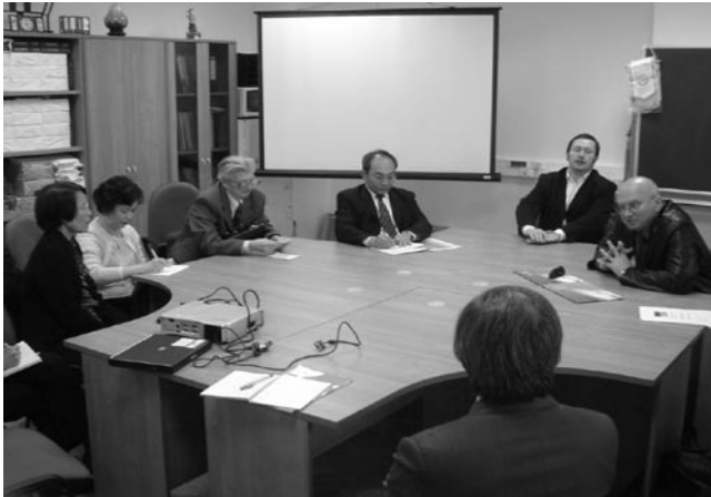
相片一 訪問團拜會莫斯科大學亞非學院，由副院長接待。