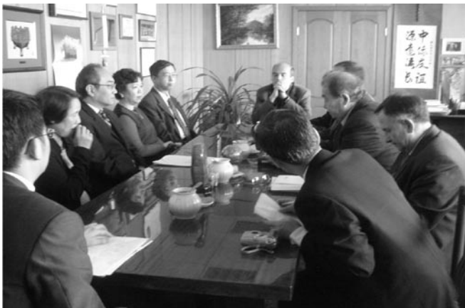
相片三 訪問團拜會俄羅斯科學院遠東所，由副所長親自接待。