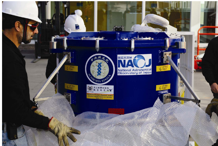
圖二 由「ALMA－臺灣」團隊組裝及測試的 ALMA 前段次系統。