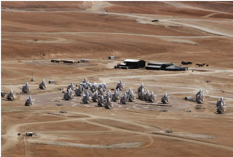
圖五 位於阿塔卡瑪沙漠 ALMA 陣列運轉基地的部份天線。今 2013 年一月底前，已有 55 座天線運達。

看到胺基酸分子或許就能回答這個問題，但現有望遠鏡靈敏度不足，無法偵測到只發出微弱訊號的胺基酸分子。ALMA 靈敏度高於現有同波段望遠鏡 100 倍，相信如果星際中有胺基酸分子，ALMA 將能看到它們，並告訴我們生命起源的故事。