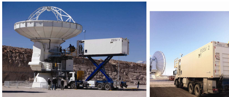
圖三 (左) FESV1 梅花©ALMA (ESO/NAOJ/NRAO)。(右) FESV2 藍鵲©中研院天文所