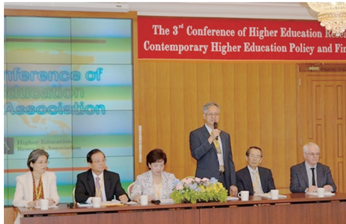
圖一：高等教育研究學會第三屆國際學術研討會