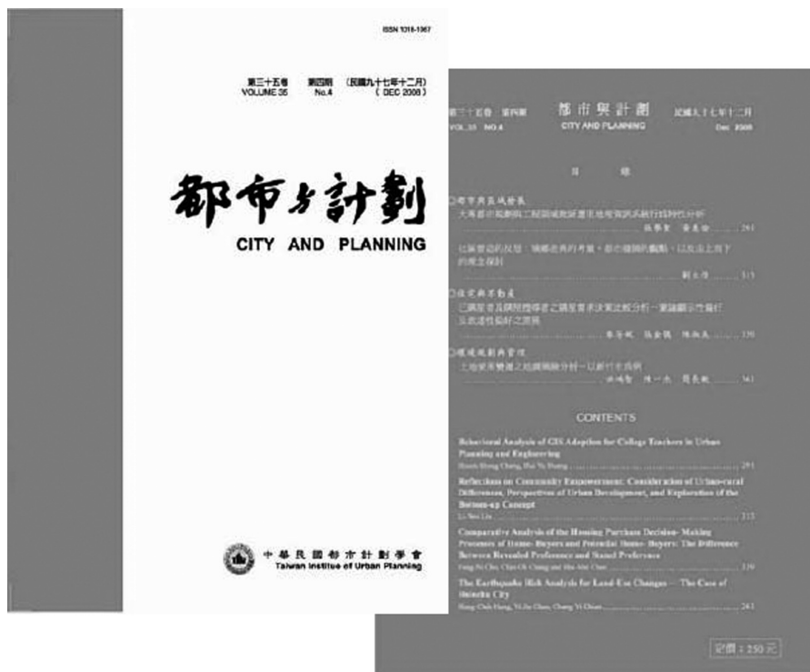
圖一：《都市與計劃》第35卷第4期封面與封底