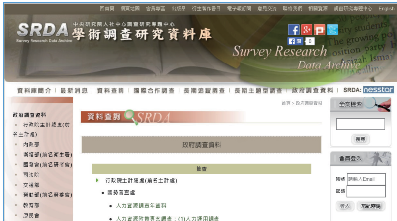
圖八 SRDA政府調查資料瀏覽畫面

直接向各部會申請與從 SRDA 取得的資料不同之處，在於 SRDA 會額外製作常用統計軟體的資料讀取程式與過錄編碼簿，並就資料檔中不應出現的數值與資料提供單位核對、更正，便於使用者分析利用。國內外大專院校師生、研究機構研究人員在加入為 SRDA 會員之後，就能上依提供資料部會要求的使用方式，從 SRDA 網站提出使用申請或直接下載政府調查資料。