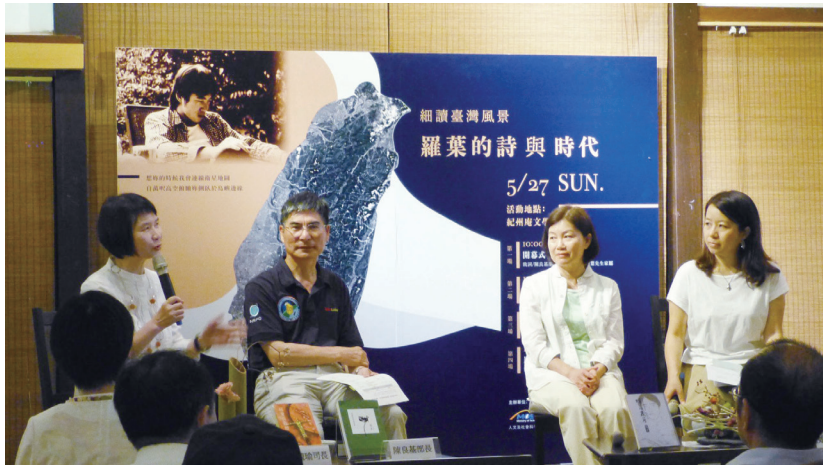
圖三：鄭毓瑜司長（左一）說明此次座談在新詩史上的意義

詩是一匹慧點的獸 你說作者像一個獵人 在文字的叢林中追蹤獵物 在奔逃之中 蓄意留下一個個線索 巧妙的暗示 欲擒故縱 渴望被捕獲 它是為了引領你 前往一處罕無人跡的 倘若你能夠一路跋涉 在那裡，它願意與你相遇 貝殼，漩渦，內在的迷宮