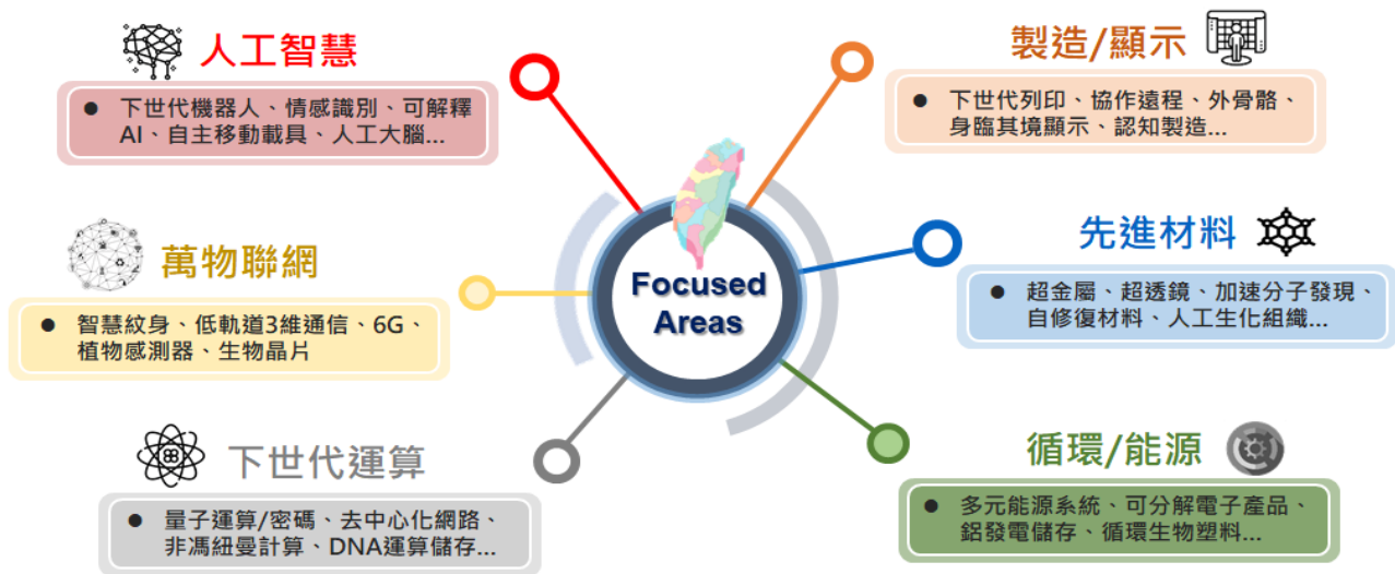
圖四、工程科技未來聚焦發展方向