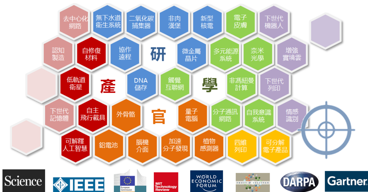
圖一、國際新興工程技術掃瞄歸納清單

濟、環境與政治)等發展面向，歸納整彙出具未來趨勢之科學技術清單。利用簡易統計，依照產業、政府、學界與研究單位等不同屬性予以分類(如圖一所示)，因所蒐集歸類的技術數遠多於圖所列之清單，後續將依不同的研究目的，應用統計剖析方法，規納出不同的系統性資訊，提供相關決策者進行政策擬定之最佳參考之用。