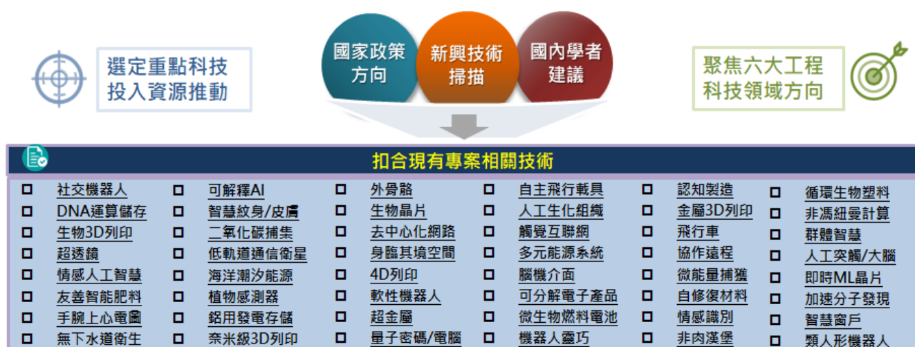
圖三、工程領域聚焦技術清單之篩選示意圖

除探討工程技術之跨領域整合趨勢，本研究之主要目的為協助工程司未來發展方向之規劃。同樣先整合國際新興工程科技掃描與國內工程學界專家建議之內容，進一步搭配現行國家重點政策方向(如6大核心戰略產業、5+2產業創新政策2.0...等)，整列出在全球新興科技、國內學者之前瞻建議、國家科技政策方向等三大議題所高度重複的技術清單如圖三所示。並扣除工程司現有專案計畫，整匯出領域性質相近之工程領域技術群組。