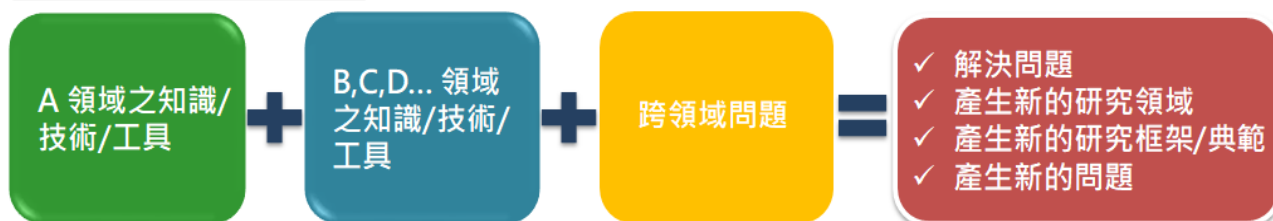
圖六、融合式跨領域研究與一般跨領域研究之異同

本案為了能確實徵求好的創新構想(Crazy idea)，除了在構想書書審的審查階段採用 雙盲審查 ，並以未限定主題的方式由申請者自由提出研究項目。以此方式執行，在審查的過程中的確徵求到非常多元之主題構想，雙盲機制也確實在第一階段篩掉了許多未符融合式創新初衷的「學門常勝軍」；但這也讓主題過於發散，加深了審查作業的難度，難以讓每一案件都能在極度專業的審視下進行。雖然仍有第二階段的「計畫審」把關，但這畢竟是涵跨四學術司全部學門領域的徵求，委員會實難完全涵蓋美一專業。建議於未來推動相似專案時，能將徵求主題更加聚焦，讓創意構想與領域專業的審查執行能達到平衡。