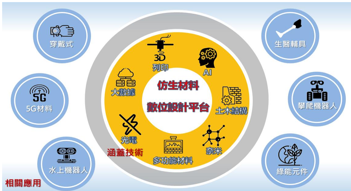
圖五、智慧仿生材料與數位設計平台計畫之跨域整合

此計畫啟蒙於美國MGI材料基因組計畫，並藉由瞭解仿生自然界中包含結構、性質與功能的核心機制，以材料科學與工程的方法，研究仿生材料與系統，同時利用材料數位技術平台，從材料設計與選擇、關鍵結構設計與驗證等角度切入，以期建立智慧仿生材料設計與材料數位技術之重要資料庫，加速材料創新。其中研究團隊取法包括大嘴鳥、植物葉綠體、楓果、蜘蛛絲、爬蟲類爪、鯊魚皮、蛇皮、撒哈拉銀蟻等生物，發展出各具創新應用的智慧仿生材料。每單一計畫至少包含本身材料領域之專業(domain knowledge)、數位技術平台/資料庫之技術、以及欲延伸應用的鏈結技術(如圖五所示)，多元的跨域整合讓此專案可以稱得上是材料學門領域的跨領域技術研究平台。