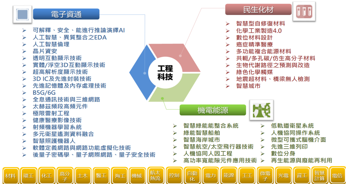
圖二、國內工程領域學界專家建議技術清單