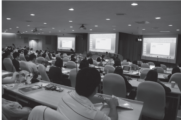
圖三 「2014 語言學卓越營：語言演變」上課情形