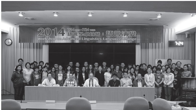
圖一 「2014 語言學卓越營：語言演變」開幕

從 2002 年起，臺灣開始倡辦語言學卓越營（Workshop on Advanced Linguistics），每兩年舉辦一次，對於促進國內語言學研究有很大的助益。回顧歷屆的發展，2002 年以「南島語言」為主題，國內外南島語言學者齊聚一堂，共同為相關領域的學者、學生提供豐富而完整的知識。2004 年以「語料庫與計算語言學」為主題，讓國內語言學相關研究的學者、學生感受到科技領域知識的震撼，提升參與者的科學計量層次，更促進國內從事語料庫與計算語言學學者的學術合作。2006 年以「意義與語法」為主題，邀請國內外知名學者，舉辦一系列的研習活動，就其專長的語境、語意的互動與語法做主題演講，推動國內語言學研究與國際學術社群接軌，將國內的語言學研究推向國際舞臺。2008 年以「功能語言學及其應用」為主題，更進一步以拓展語