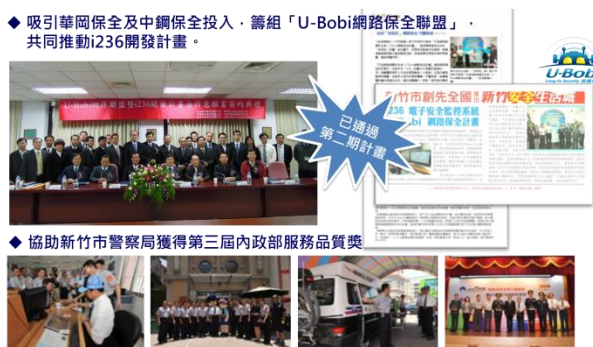
U-Bobi 網路保全聯盟暨 I236 開發計畫內容

Company(實驗室公司)四大核心運作引擎，將科技部既有之能量與資源，成功轉化成為具有產業價值、公益價值、服務價值之各種系統整合解決方案(system solutions)與創新服務模組(service packages)，以發展成為智慧社區。此外，透過智慧電動車加值應用、智慧電網、行動觀光服務系統規劃與農村智慧化行銷等相關方案，建立智慧城市。進而依據愛台十二項建設中智慧城市政策，以及建立擁有智慧化安全聯防服務系統之智慧型小鎮，涵括社區監視系統與警察局路口監視器為基礎，導入 IVS 影像偵測與分析功能、整合 110e 化勤務指揮系統，透過即時影像資訊之傳遞達到犯罪發生即時報警、事前預警等功能。