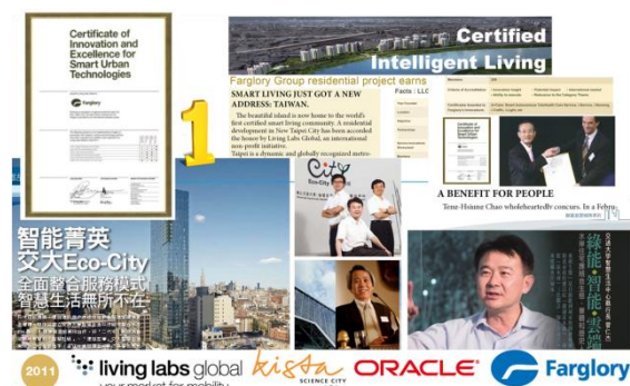
LLG 國際認證內容與宣傳

此外，該中心部份成果亦遞交到全球智慧生活聯盟(Living Labs Global, LLG 現改名為 Citymart.com)進行國際評比。其中 i-home 居家智慧面板管理服務、i-Service 智慧生活數位服務平台、i-Sensing 智慧環境感知資訊整合系統、i-Care 自主健康管理照護系統、i-Traffic 智慧低碳交控網絡系統、i-Light 綠色照明 LED 路燈等六項系統通過 LLG 國際認證。而 i-Care 除了認證之外，更從超過 254 個案例中脫穎而出，與全球其他八大城市共同獲頒為最佳案例獎項(showcase award)。將台灣智慧競爭力帶往國際級能見度。