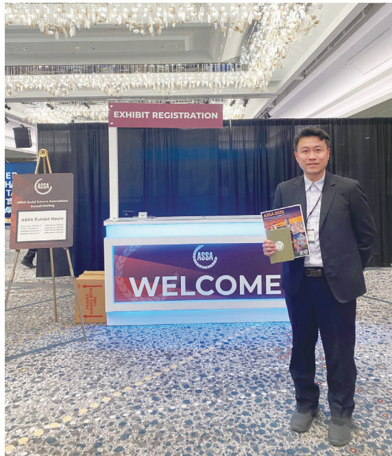
圖四：筆者於2025年赴美國AFA Meeting在舊金山所拍攝

最後提出一些對年輕學者的其他研究建議：(1) 努力不懈：建議在教學與服務之餘，如果健康狀況許可，一週至少要專注於學術研究 30-40 小時以上；(2) 永不放棄的強大信念：設定目標與夢想，不要半途而廢，並結伴而行，為夢想而努力。最後我想鼓勵年輕學者：只要你持續努力並永不放棄，一定可以追求卓越，挑戰學術的巔峰。