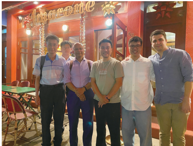
圖三：筆者與博士班學生赴紐約 Fordham University 進行移地研究