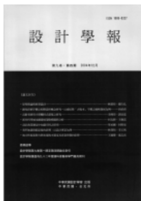
圖 1 設計學報

提筆之際，不禁使我回想起十年前一群在設計領域教學及工作的朋友，有鑑於設計學研究及實務的成果，無處可以發表，感到惋惜。乃推動成立「中華民國設計學會」，為會員提供參加學術活動的機會，並明訂其主要的宗旨是出版《設計學報》（圖1），搭起一個學術平台，讓會員有機會登台發表研究及