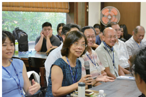
圖三：「第 19 屆休閒、遊憩、觀光學術研討會暨國際論壇」於嘉義縣板頭社區進行參訪