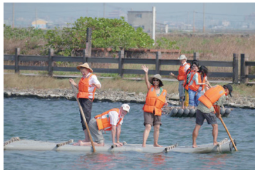
圖二：「第 18 屆休閒、遊憩、觀光學術研討會暨國際論壇」於鰲鼓溼地——自然教育參訪