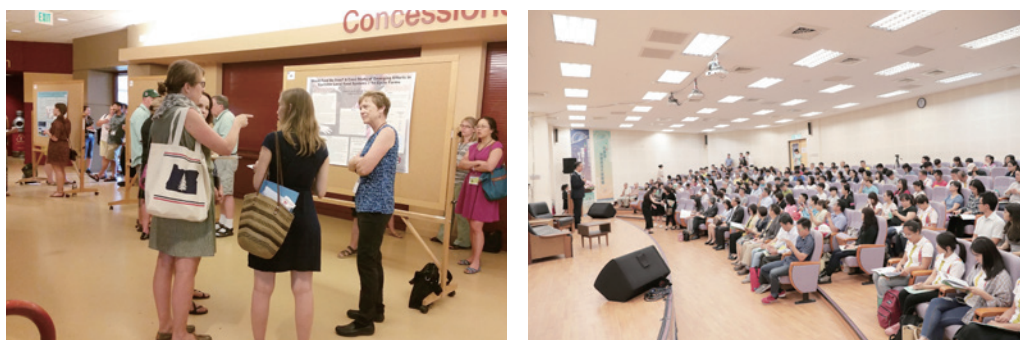
圖四：學會會員參加國內外舉辦相關學術研討會之活動花絮

為促進國內休閒、遊憩與觀光相關領域之各級學術單位、學（協）會組織、政府部門、專業團體等之研究風氣及獎勵優秀論文，研討會特設「休閒、遊憩、觀光學術研討會論文獎」，以發掘優秀研究人才、鼓勵研究創新與落實應用價值。於每年度評選出「傑出會議論文」、「優良海報論文」及「海報論文最佳人氣獎」，由主辦單位視作品水準決定獎勵名額與獎勵方式，並安排得獎論文之作者在研討會閉幕式中接受頒獎表揚。