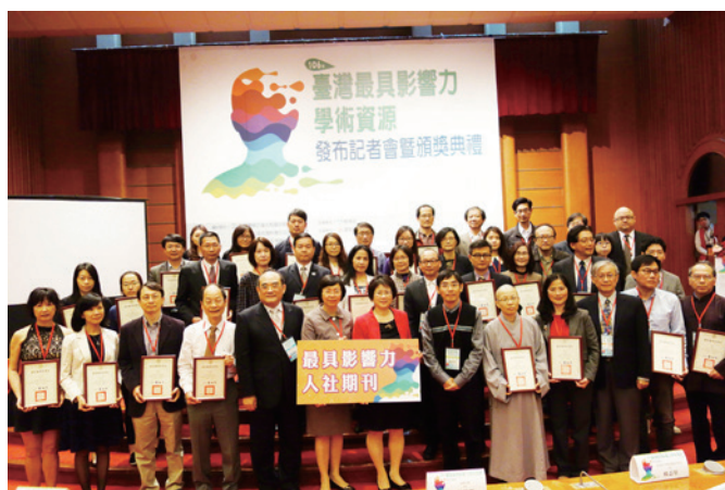
圖六：本會期刊於 106 年 3 月 31 日參加「臺灣最具影響力學術資源發布記者會」，並獲頒「最具影響力人社期刊」之獎項