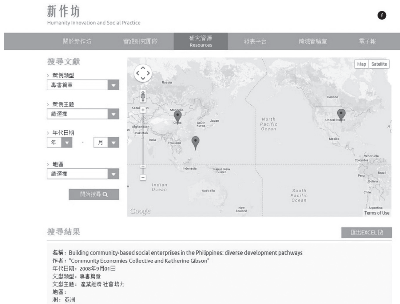
圖五 文獻案例搜尋頁面截圖示意