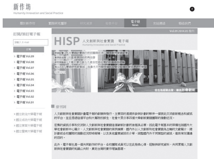
圖十 電子報網站頁面截圖