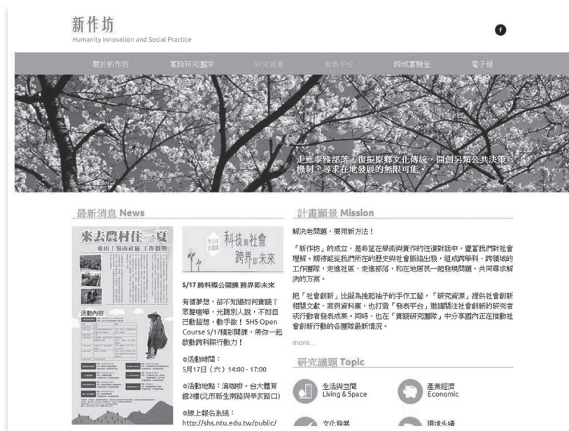
圖四 網路平台(新作坊)截圖

配合人文創新與社會實踐計畫，建置資料庫與網站供計畫成員與大眾進行資源分享與交流。本網路平台目前已建置完成，內容包含計畫之說明、實踐研究團隊（政治大學、成功大學、東華大學、暨南國際大學）介紹、文獻與