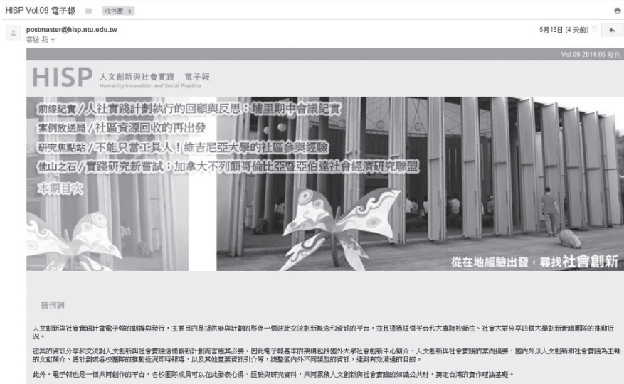
圖十一 電子報發送頁面截圖

日前以 issue 線上閱覽，EDM 郵件格式發送，並製作為 PDF 全文之電子報共 7 期（2013.09~2014.04，2.3 月併為一期，PDF 全文詳參 http://www.hisp.ntu.edu.tw/news/epapers （點選左方欄位可看所有期數）。