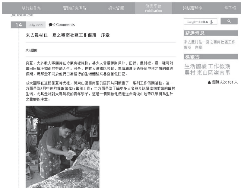
圖八 發表平台文章呈現頁面截圖示意

本計畫的研究者，以及使用本網站的大眾，可透過此空間相互交流，增加知識分享與實踐互動，除有利於計畫進行外，對於人文創新與社會實踐理念亦可呈現加乘效果。