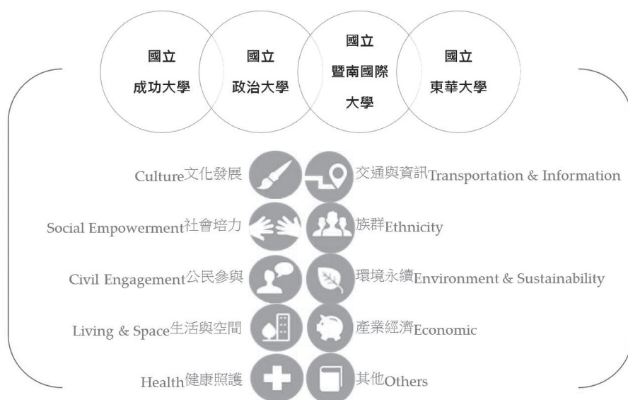
圖二 四校團隊與對應研究主題

文化發展、環境永續、社會培力、族群、公民參與、交通與資訊、健康照護、其他等。所蒐集國內外有關人文社會實踐的文獻，包括期刊論文、專書、專書論文、碩博士論文及研究報告。本計畫成員將所蒐集的文獻，除自編ID、擷取文獻圖片、文獻名稱、文獻作者、年代日期、地點、語言、來源出處、相關連結外，並自訂文獻類型、關鍵字，分類文獻主題、研究方法、研究屬性與分析工具等欄位，進行格式彙整，並加以閱讀後歸結摘要，提供使用者瀏覽。