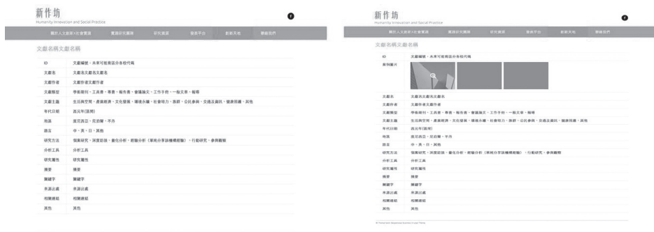
圖六 文獻案例資料呈現頁面截圖示意