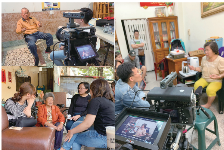
圖八：前草在地居民生命歷程訪談

在該區域的社會創新上，團隊以「過渡社區創生基地空間連結」、「勞動精神策展再現」、「在地青少年學習陪伴」、「在地故事戲劇展演」四個面向進行。成立「過渡社區創生基地」：「前鎮國小智學坊」、「草圖策展場」(草衙圖書館)，智學坊提供大學與地方中小學對接的學習場域，將大學資源與地方中小學連結，發生共學效果；而草圖策展場則將我們與地方開採的結果，轉譯成具有與地方溝通的策展活動，藉以培育在地居民的地方認同。「在地青少年學習陪伴」上，除了結合田野調查，亦將與在地國小、國中課程與社團合作，帶領在地青少年深化在地情感。在「在地故事戲劇展演」方面，團隊將田野調查論述轉譯為劇本，並與中山大學 USR-C 計畫連結帶入課程，捲入相關利害關係人，包括在地