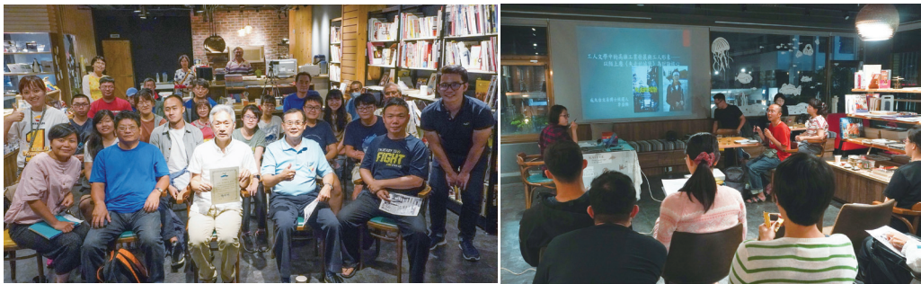
圖七：鹽埕書(抒)憶活動