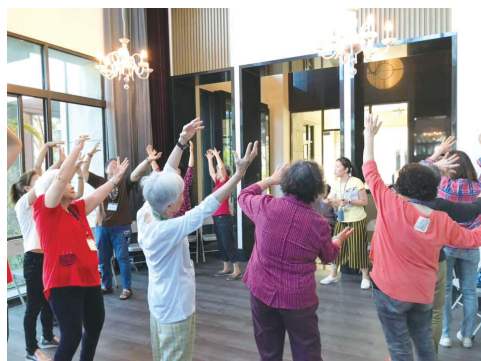
圖四：果貿媽媽社區劇場