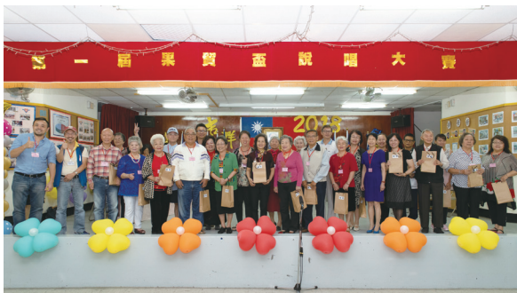
圖一：果貿盃說唱大賽參賽者與評審大合照

系列活動。「渡·左營」活動前期的三場座談會，5月已於高雄市立總圖書館和駁二藝術特區舉辦，在場吸引了多位關心舊左營的在地青年及藝文工作者參與，顯示左營團隊過去將近一年的在地耕耘已逐漸發酵並擴散。