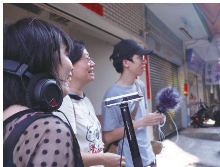
圖二：聲景採集工作坊