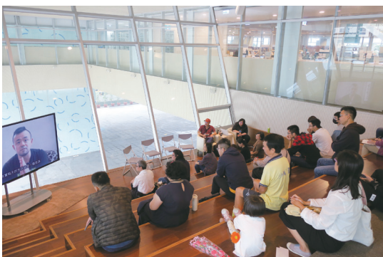
圖三：「渡·左營」活動座談會