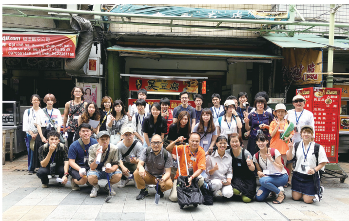
圖十：青草街工作坊

經由持續盤點空間的行動，本組還衍生出一隅的手作創生聯盟，結合在地的手作職人，進行為期三個月的進駐案；另外，千越大樓也正釋出一個閒置空間，藉由整理與活化，促成其可再被利用的可能性。空間組嘗試各種於場域內結合彼此專業之可能性，期望從中累積研究與創作的素材，作為在地持續經營發展的基礎。