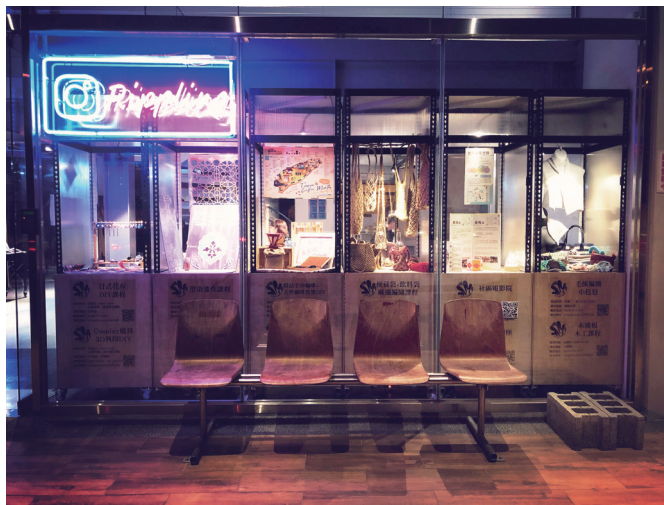
圖十二：一隅藝文空間與手作創生聯盟

再者，孔博士以本身專業補足本計畫與基層學校和社大較無接觸的缺憾，與國高中小老師組成「城市觀察」群組，並與社大合辦「樂活台中舊城」系列活動，企圖培養喜愛舊城文史的社群。