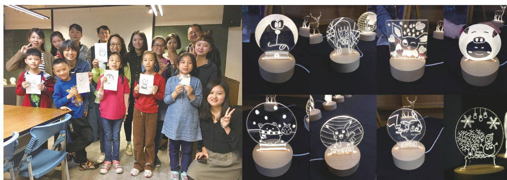
圖八：數位創新工場

本計畫首先以親子為對象，發展出與電子街有關之數位創新工場。藉由數位LED燈及繪圖軟體結合雷射切割，讓親子發揮創意當場實作個性夜燈。對應到中區電子街商圈，讓一般民眾了解電子材料也可以製作出時尚物品，希望藉