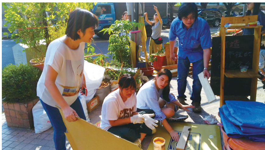
圖六：大同國小花園

農場組主要希望透過與在地工作團體共同推動都市農園，將食農教育、可食地景、永續自產安心作物、友善土地之理念與願景推廣至社區居民、社群、與鄰近學校團體。由學校、社區居民、社群一同耕種，藉由共工、共學、共享的方式進行交流，建立人與土地環境的新關係。透過與在地工作者協力合作，以及對中區街廓內的觀察後，方可歸納出地方綠化、植栽養護之現況，同時探討地方綠美化、都市農園之相關行動方案推動之可能性；另一方面，透過綠美化的空間營造過程，漸漸地影響鄰近住家、店家等，引起關注後進而產生共鳴，再邀請志同道合之民眾一同進行綠美化、都市農園等營造，透過植栽召集更多民眾共學、共工，同時獲得更多交流與認識的機會。