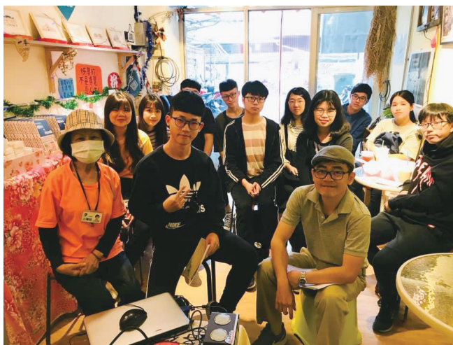
圖十一：學生參訪交流看見台中城

這些社區蹲點與合作，目的除了後續研究的撰寫外，主要是與人社實踐計畫各組互相搭配，形成更為聚焦的行動主軸。二市場的田調、台中城的合作、拾瑞巧咖啡的串聯，主要便是搭配市場、農場組的各類活動，如二市場的各項展覽、綠食軸線（都市綠化等議題）等；而 1095、綠川漫漫、博後討論會等，則希望慢慢與劇場組的論述力、劇場主旨互相搭配。這樣的串聯是基於共好的原則，也就是說，並非要求社區（群）執行我們的目標，而是在了解社群關切的議題及優先順序後，與人社實踐計畫內部協調，互相調整，找出一個有利於雙方的行動方案。