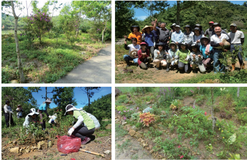
圖九 瑪璘窟蝴蝶棲地營造計畫活動照片