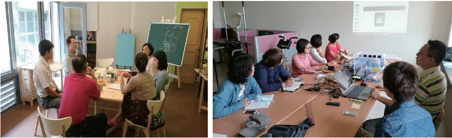
圖十 埔里 PM2.5 空汙減量志工會議

點，設置低階空汙監測站，作為 PM2.5 空汙減量公民科學自主監測的示範基礎。至於黃彥宜教授，則是期盼透過社區劇場的方式，藉由大型布偶的裝置藝術、劇場表演形式，作為基層社區空汙減量的宣導工具。總之，期盼透過志工培訓、科學監測與社區劇場等多元方式，喚起更多鎮民關心埔里 PM2.5 空汙議題。