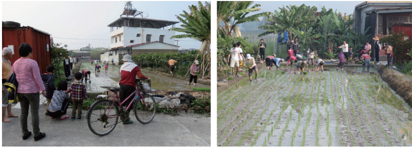
圖五 「籃城公田」的插秧活動