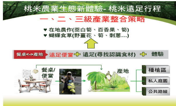
圖二 桃米休閒農業從產地到餐桌的體驗設計圖