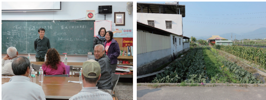
圖四 社區理監事會中的討論籃城公田、社區公共菜園計畫