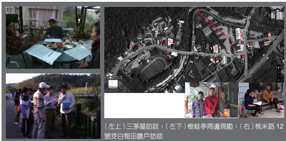
圖三 災害潛勢區位及歷史災情之調查圖 (資料來源：暨大人社中心桃米駐點團隊)

邀請原本已任桃米社區休閒農業推展協會輔導老師的暨大觀光系曾喜鵬助理教授，與社區幹部探討如何在社區內利用原本已蓬勃發展的「三級產業」帶動一級產業、二級產業的發展之可能性。經過半年的調查與討論，嘗試結合「電動自行車」的低碳交通載具，以及「從產地到餐桌」的食材製作，研發出「桃米遠足野餐創意體驗行程」，期盼以桃米生態的旅遊場域，透過手作遠足野餐便當的創新體驗來推廣桃米農業與生態，達到桃米綠色產業發展的目標。