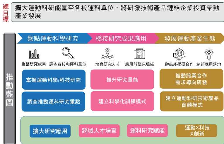
圖一：運科擴能計畫推動架構

因此，行政院提出「台灣運動×科技行動計畫」(111 至 115 年)，以 Sports Everywhere 為願景，投入資源在運動科學研究及應用，提高運動科學的支援量能，以提升頂尖運動選手的競技能力、擴大國人的運動風氣，進而帶動臺灣運動科技產業向上發展(行政院，2022)。「運動科學擴能」可以定義為運動科學知識、技能和策略的應用，以提高個人、團隊或社會的運動表現和健康水準，進而達到更高的生活品質和幸福感(Meeusen et al., 2013; Gabbett, 2016)。運科擴能之主要目的使個人能夠理解和應用運動科學原則，從而改善運動表現和健康狀態，並在生活中各個方面獲得積極影響(Joyner & Coyle, 2008)。國科會補助之「擴大運動科學研究能量與成果橋接計畫」(簡稱運科擴能計畫)，便是以建立跨域人才培育、運科研究賦能、以及學研合作之基礎資料計畫，推動架構如圖一。