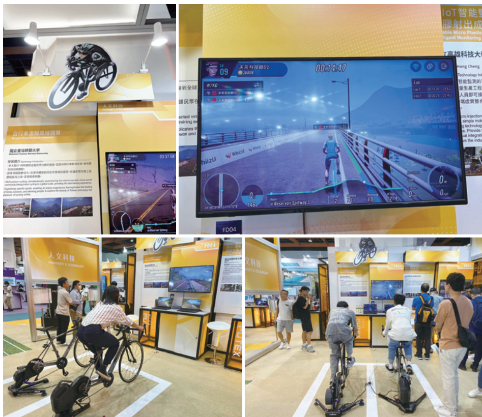
圖三：自行車虛擬路線開發成果展示於2023未來科技館

此次布展後的效益包括協助新創公司在提升運動產業之健身車運動創新服務之服務效率與服務品質升級；結合研發與服務能量並進行跨領域之異業合作與結盟，合作共創新的優質運動科技創新服務；帶動智健身車服務產業價值鏈的合作與推動，引發跨產業應用的技術升級，推動智慧科技相關技術之發展；個人化健康運動需求的科技化服務支援與推動，讓消費者獲得更有感、更便利之使用體驗。