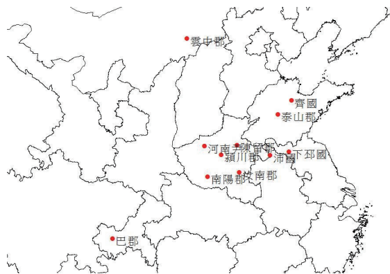
圖二：漢代《風俗通義》所載口頭傳說發源地