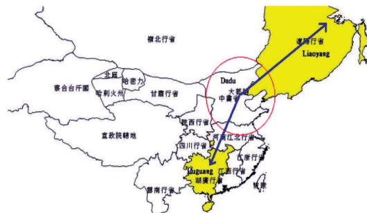
圖四：清代放逐地點