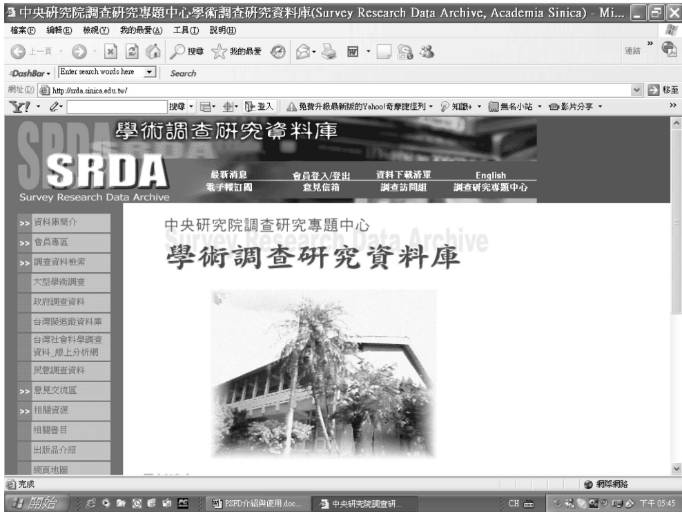
圖三 調研中心「學術調查研究資料庫」首頁

網頁、「學術調查研究資料庫」網頁公告，並透過「學術調查研究資料庫」電子報等方式發布訊息。而釋出檔案包括問卷、過錄編碼簿(codebook)、資料檔（含 SAS、STATA、SPSS 系統檔）、次數分配表等。由於「學術調查研究資料庫」是採取會員制，在經過簡易的申請手續取得會員資格後，即可線上申請下載相關檔案。 3 目前 PSFD 的釋出資料，包括 1999-2006 年的調查資料。