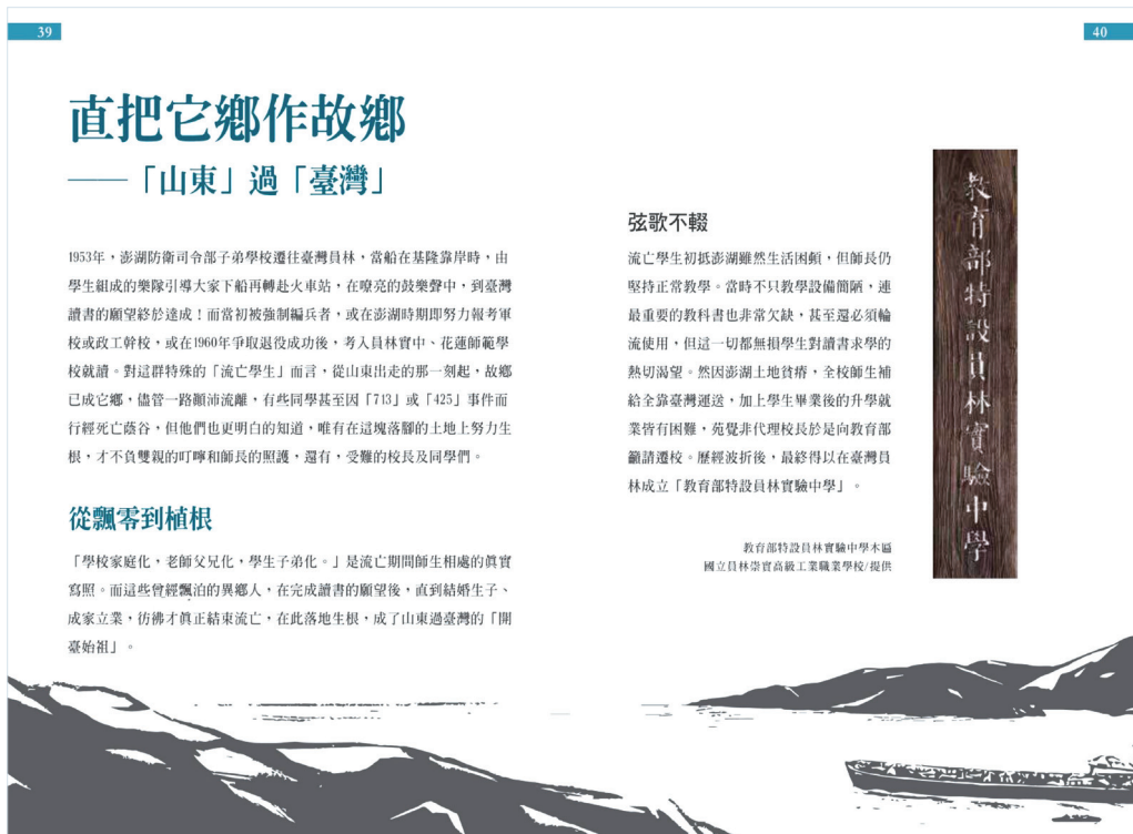
圖二：「山東流亡學生與澎湖 713 事件 70 周年特展」導覽手冊

2018 至 2019 年間，林教授獲人權博物館邀請，與成功大學歷史系謝仕淵教授（前臺灣歷史博物館副館長）共同策展「山東流亡學生與澎湖 713 事件 70 周年特展」，然而此前林教授未曾有籌備或策劃展覽的經驗，因此又是對於另一個專業領域「從零開始」的新體驗。在籌備過程中，除了積極收集各種檔案、文件、照片外，也使團隊開始意識到，對於山東流亡師生生命經驗的認識，不能僅限於事件者本身，必須從他們在臺灣落地生根的視角出發，拓展至其家人的記憶，例如大多數孑然一身來臺的學生們，他們如何認識共結連理的配偶？這些另一半的身分與族群為何？如何克服文化差異建立家庭？他們的下一代如何建立自我的認同？這樣的家庭又帶給臺灣社會怎樣的影響？諸多問題都實質地擴展了計畫團隊對於山東流亡學生特殊生命記憶的認識，也獲得來自他們親屬不同視角的補充，使上下世代的對話變得立體，更從單純的個人移民史往家庭移民史的方式轉變。