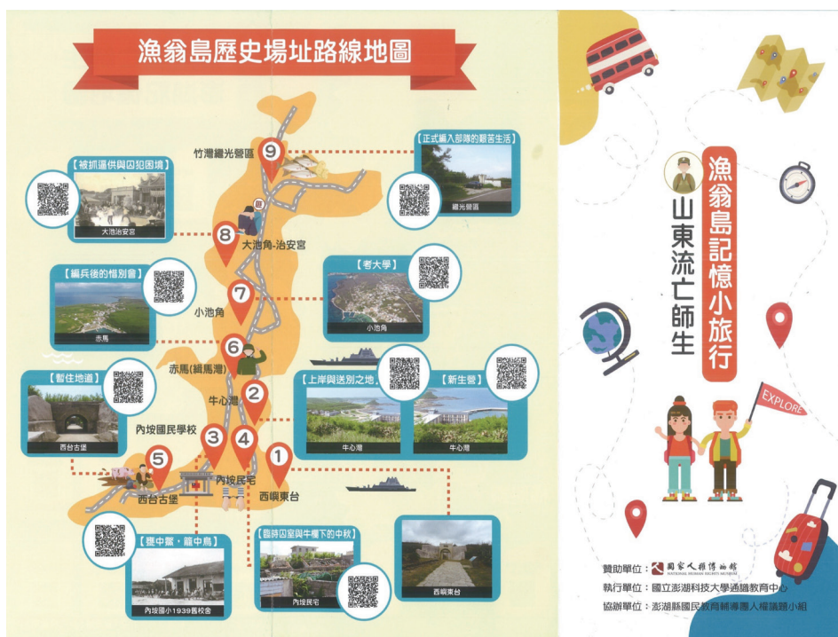
圖三：漁翁島記憶小旅行路線圖

713 事件特展於 2019 年 7 月 13 日至 11 月 3 日在澎湖開拓館與人權館景美園區展出，展出內容可概分為：流亡（讀書）、編兵及冤獄案、故鄉與新故鄉、記憶跟真相等四大項，此外也舉辦人權教育推廣活動，邀請山東流亡師生當事人或其下一代現身說法，分享他們（或他們父親）如何流亡來臺落地生根及與臺灣社會生活互動的點滴，促成山東流亡師生與他們的第二代在講座中齊聚一堂，獲得不小迴響。上述相關成果亦於 2022 年底整理出版為《成為臺灣人——山東師生到臺灣的流離與扎根》上下兩冊，本書更榮獲國史館臺灣文獻館 113 年獎勵出版文獻書刊「推廣性文獻書刊」優等獎。