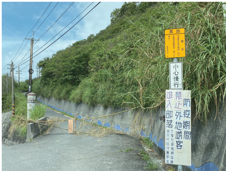
圖二：設立簡易的社區封鎖聲明與路障

在臺灣，除了因為曾經走過 SARS 風暴，也因為健保制度，至今似乎尚未看到比較特殊差異的族群結果或影響的因應政策，但有一些零星討論。例如部分族群啟動傳統儀式除疫（穢）；有些倡議傳統飲食，透過食療提升免疫力以抗病毒等；有些擔憂社區年長人口較多，提供族語防疫宣導的資訊（圖一）。舉行祭典時，呼籲外人盡量不去「湊熱鬧」，讓內部可以在減少群聚風險時進行儀式。有些在疫情比較嚴重時，執行設檢查站攔車檢查，杜絕外人進入社區（圖二）。由於多數原住民族地區在人口結構老化及醫療資源缺乏的多重弱勢下，因此擔心防疫破口的情形一直都在，例如去年清明節連假前，四個原住民族組織共同發起「關懷原住民族健康之『防疫』聯合聲明」，呼籲原住民族社區防疫。