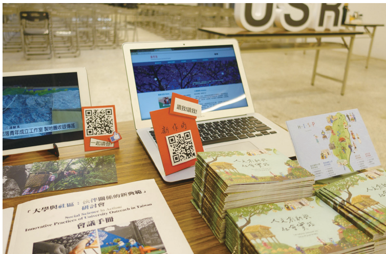
圖三：參與教育部大學社會責任（USR）推動中心舉辦的日本地方創生行動家木下齊演講。在現場擺攤推廣之外，亦將演講內容整理成報導，提供各界參考

在電子報部分，除了每月持續發送人社實踐計畫動態新訊外，對內則邀請大學團隊成員撰文分享實作方案、實踐省思、倡議論述，透過書寫轉譯實作過程中的在地經驗及知識，將行動能量向外界傳遞，並蓄積未來學術研究之基礎素材。對外則由電子報編輯群及專欄作者，採訪民間從事社會創新的個人、組織或店家，以及擴寫資料庫中的相關創新案例，引介國際社會創新發展趨勢。這些記錄、報導與評論文章，一方面將資料庫內容向外延展深化，另一方面也回過頭來擴充資料庫的質與量。再配合網站中「實踐研究團隊」定期更新的推動資