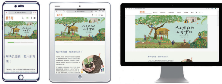
圖五：新版「新作坊」網站能滿足不同載具的螢幕需求