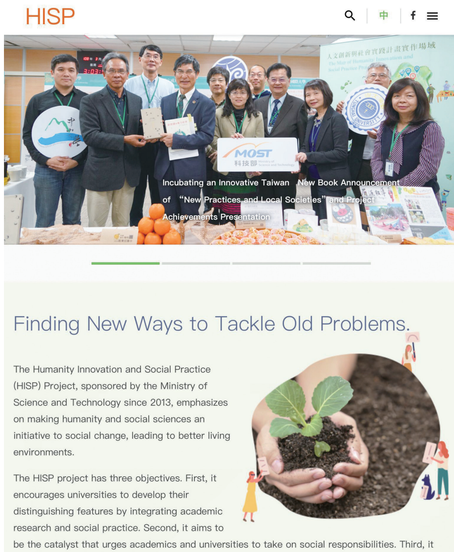
圖七：新作坊英文網頁（平板電腦版）

這份嶄新而嚴謹的學術刊物公開徵求與學界參與社會實踐相關議題的研究論文、研究手札、實踐紀要、文獻評述、書評五種類型稿件，文稿的投遞、審查、刊登均採用「新作坊」網站「發表平台」所提供的線上作業系統，稿件隨到隨審，注重審稿的效率與品質。未來在積累一定的成果之後，規劃將這些研究心血透過外語翻譯、編輯專書或是創辦英文期刊等方式和國際社群分享，擴大和全球的連結。