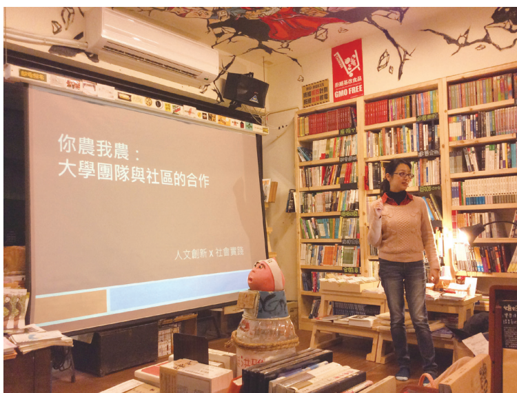
圖四：於嘉義洪雅書房舉辦「你農我農：大學與社區的合作」分享會

訊，還有開放給第一線實踐者分享創新實作經驗和學術研究成果的「發表平台」，讓新作坊成為一座隨手可存取、隨處可參考的大型資料庫及工具站。