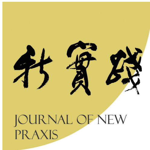
圖八：《新實踐》的投稿、審查、刊登運作，均採用新作坊「發表平台」提供的線上作業系統