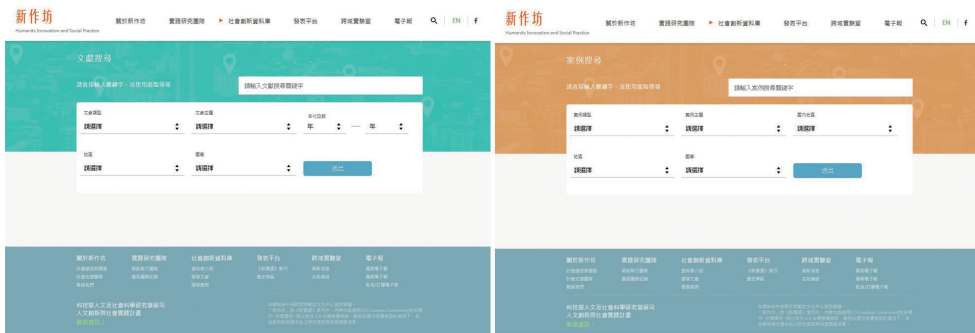
圖六：不論是文獻搜尋(左圖)或案例搜尋(右圖)，都提供關鍵字與進階搜尋功能，協助使用者查找資料

在「社會創新資料庫」部分，則是大幅改善了資料庫「關鍵字」的搜尋精準度，使用者可任意鍵入字辭進行資料庫全文搜尋，即可尋獲相關資料。另外，為服務外籍訪客，並因應國際學術社群互動合作等需求，新增了英文網頁。點進英文版網頁，在與中文版首頁相同的設計風格中，可看見人社實踐計畫、資料庫及相關刊物簡介，亦設置留言板功能，提供國外相關研究者與行動者能迅速掌握臺灣學界發展人文創新與社會實踐之概況，也為進一步的國際交流合作奠定溝通基礎。