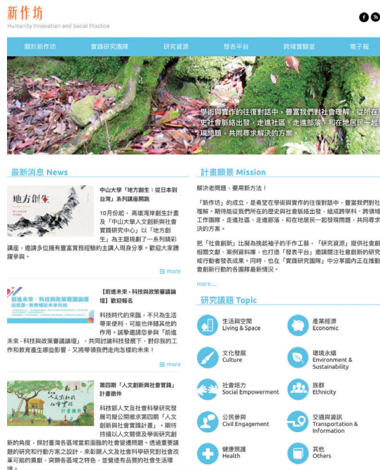
圖一：舊版「新作坊」網站首頁

同時因應人社實踐計畫推動之所需，計畫主題網站與資料庫建置工作共同展開，創設了兼具計畫官網、資料庫、發表與交流平台等多功能型的「新作坊」網站。網站中除了收錄計畫與執行團隊介紹、公布最新消息外，主要為提供所收集資料之儲存與檢索等功能，並加入電子報訂閱發布與計畫成員的寫作論壇，作為經驗分享、學術發表的成果推廣及資訊流通平台。