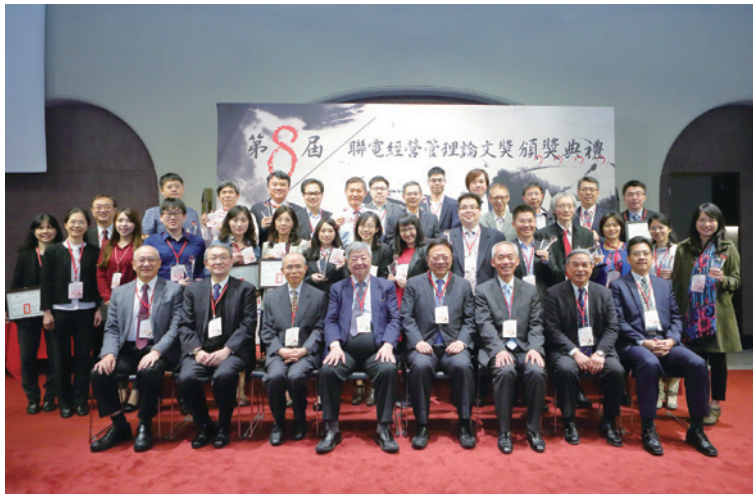
圖四：2018 年舉辦第八屆「聯電經營管理論文獎」頒獎典禮

這項活動辦理至今已第九屆，從過去少數期刊參與推薦，到近幾年過半數的 TSSCI 管理學門期刊都共同參與，也顯示此項獎項已深受國內管理學界之推崇與重視。