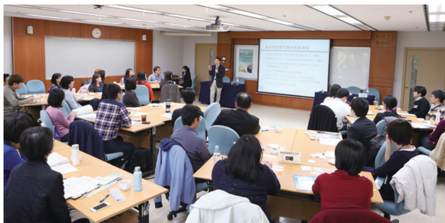
圖二：舉辦「管理學報學術工作坊」

為鼓勵從事管理工作著有績效者，本會分別設立了「呂鳳章先生紀念獎章」、「李國鼎管理獎章」及「管理獎章」。