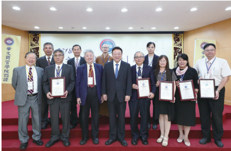
圖六：2018 年 ACCSB 授證儀式

鑑機構」推展 ACCSB 認證；隨後數年因應各大學不同之需求，又衍生出 ACCPB (Accreditation of Chinese Collegiate Program of Business) 及 QACPB (Quality Assurance of Collegiate Program of Business) 兩種證書型式共同為臺灣的大學商管教育品質把關 (相關資訊請參考 www.management.org.tw/business.php )。2017 年本會經教育部委請專業機構組專家委員會評估後，再度通過認可：凡通過本認證之商管學院，得向教育部申請免接受系所評鑑。