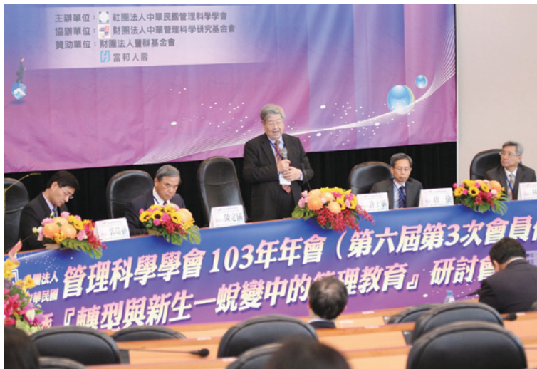
圖五：2014 年年會舉辦「轉型與新生——蛻變中的管理教育」研討會

近幾年研討會主題方向有談及管理教育發展、高等教育的挑戰、社會企業風潮、數位時代新思維、臺灣產業的變遷等，吸引各界人士一同參與交流。我們希望年會研討會所帶來的管理新知不僅係只有學術人士參與，並邀請產業界、政府單位人士一同對於這些管理議題提供不同觀點及看法，使學術發展能擴及至各領域，產生不同新思維。