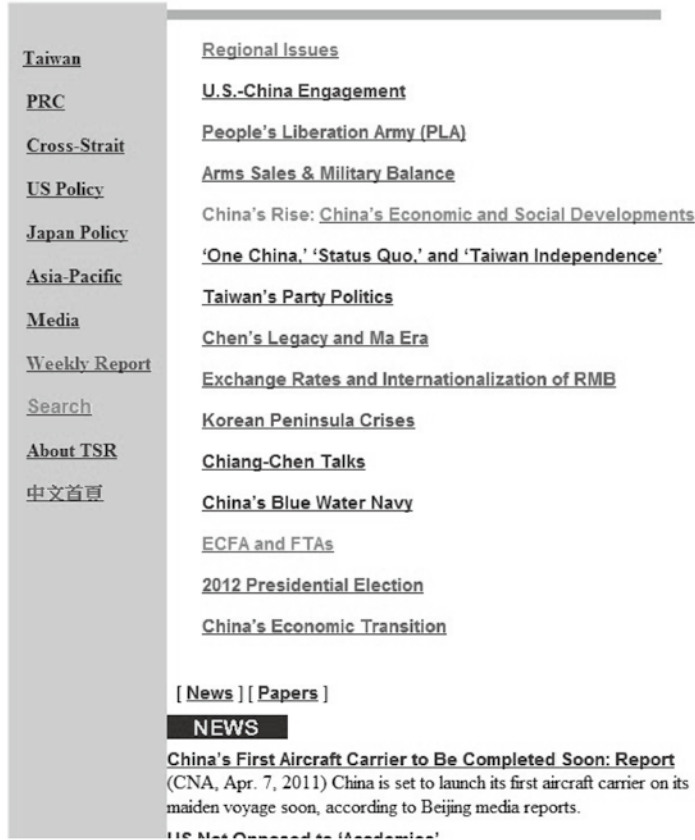
圖一：Homepage of Taiwan Security Research (English Edition)

文網站相輔相成。中文網站亦採每日更新當天訊息方式執行，以收網際網路之時效性。此外，除既有 TSR Weekly Report 英文週報，並彙整發行中文週報，於每週一公佈在國際事務首頁上。中文週報已建立資料庫於中文首頁之「週報」內，使用者可搜尋並瀏覽每一期國際新聞及評論之中文摘要與中文標題，以獲知歷年來每週詳盡的臺灣安全與國際事務訊息（圖二）。