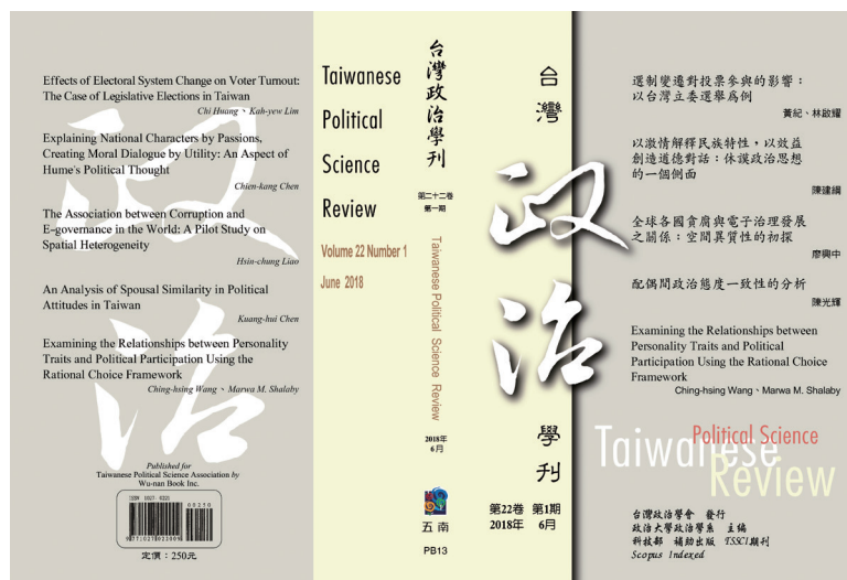
圖四：《台灣政治學刊》封面

《台灣政治學刊》( https://www.tpsr.tw/zh-hant ) 為台灣政治學會出版之學術刊物，目前由國立政治大學政治學系主編。學刊在學術表現優異的編輯委員支持下，得以堅持嚴謹的程序與高品質的水準，於每年 6 月及 12 月出刊，每期出版 5 篇研究論文。學刊在本會第一任會長吳乃德教授的大力推動下，創刊號於 1996 年 7 月出刊，當時正值台灣威權體制解體與民主轉型之際，政治學研究空間為之寬闊，學者更積極投入多元議題。創刊以後至 2002 年間，每年出版一刊，每刊文章 4 至 6 篇不等（1999 年未出刊）。自 2003 年起，在時任總編輯黃紀教授的努力下，轉型為半年刊，一年發行兩期，每期 4 至 5 篇文章。學刊於 2010 年 12 月發行的第 14 卷第 2 期刊起，固定刊登一篇英文論文，迄今已 8 年，