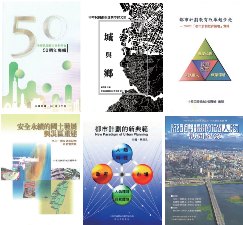
圖三：學會近期出版專書